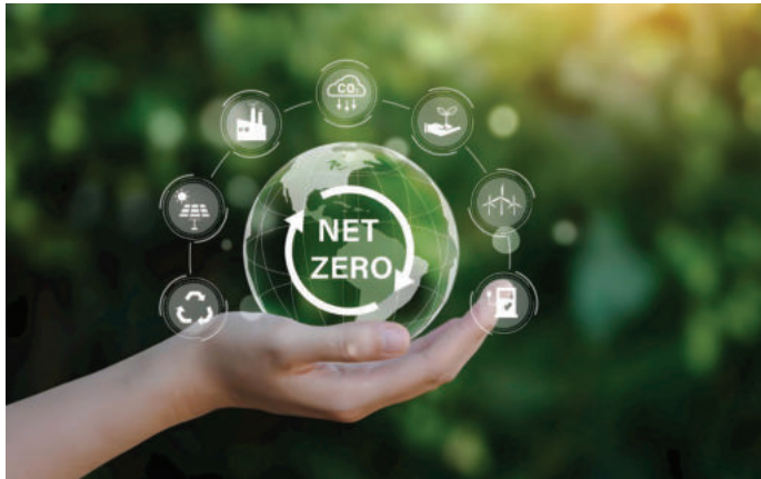
► Việt Nam quyết tâm thực hiện mục tiêu giảm lượng phát thải ròng về 0 vào năm 2050.

khu vực nông thôn; tỷ lệ lao động thất nghiệp còn cao, trong 10 năm từ 2015 đến nay (khoảng 2,3%); tình trạng dịch chuyển lao động đến các khu công nghiệp tập trung, các đô thị phát triển, di cư tự do từ nông thôn ra thành thị gây áp lực cho việc giải quyết việc làm, giải quyết mối quan hệ cung cầu trong thị trường lao động và cơ sở hạ tầng ở các đô thị.