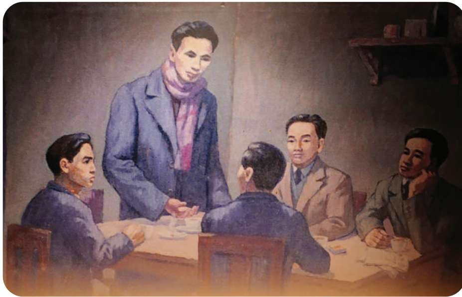
► Tranh minh họa Hội nghị thành lập Đảng vào mùa xuân năm 1930 của họa sĩ Phi Hoành tại Bảo tàng Lịch sử cách mạng Việt Nam.

Sự ra đời của Đảng Cộng sản Việt Nam là dấu ấn khơi nguồn cho những thắng lợi vĩ đại, vẻ vang của sự nghiệp cách mạng Việt Nam trong 96 năm qua và mãi mãi về sau. Sự lãnh đạo sáng suốt và đúng đắn của Đảng ta đã đưa dân tộc Việt Nam thoát khỏi ách áp bức, nô lệ, giành độc lập dân tộc và thống nhất đất nước, mở ra kỷ nguyên độc lập, tự do và chủ nghĩa xã hội; kỷ nguyên thống nhất đất nước, đổi mới, phát triển; và nay là kỷ nguyên vươn mình của dân tộc, vì hòa bình, độc lập, dân chủ, giàu mạnh, phồn vinh, văn minh, hạnh phúc, vững bước đi lên chủ nghĩa xã hội.