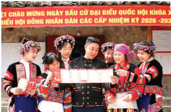
► Cán bộ tuyên truyền về bầu cử cho các cử tri tại nhà văn hóa thôn Lô Lô Chải, xã Lũng Cú, tỉnh Tuyên Quang.