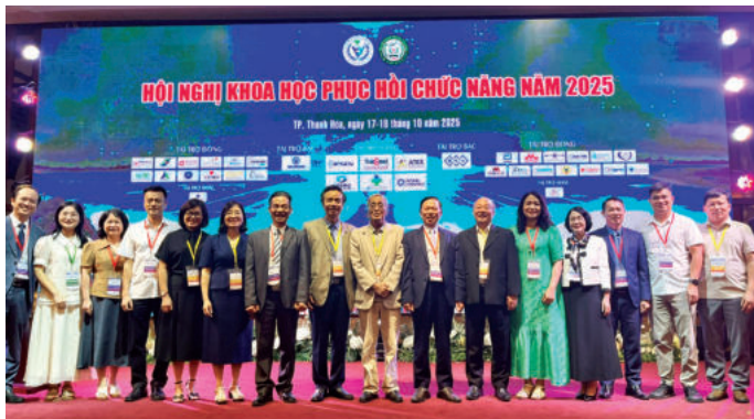
► Hội nghị Khoa học Phục hồi chức năng toàn quốc năm 2025.

Đ ược thành lập ngày 05/3/1991 theo Quyết định số 50 của Chủ tịch Hội đồng Bộ trưởng, Hội Phục hồi chức năng Việt Nam ra đời trong bối cảnh ngành PHCN còn nhiều hạn chế về tổ chức và nguồn lực. Với tư cách là tổ chức xã hội - nghề nghiệp tự nguyện, Hội đã từng bước quy tụ đội ngũ chuyên gia, thiết lập nền tảng chuyên môn và thúc đẩy PHCN trở thành một bộ phận không thể tách rời của hệ thống y tế quốc gia.