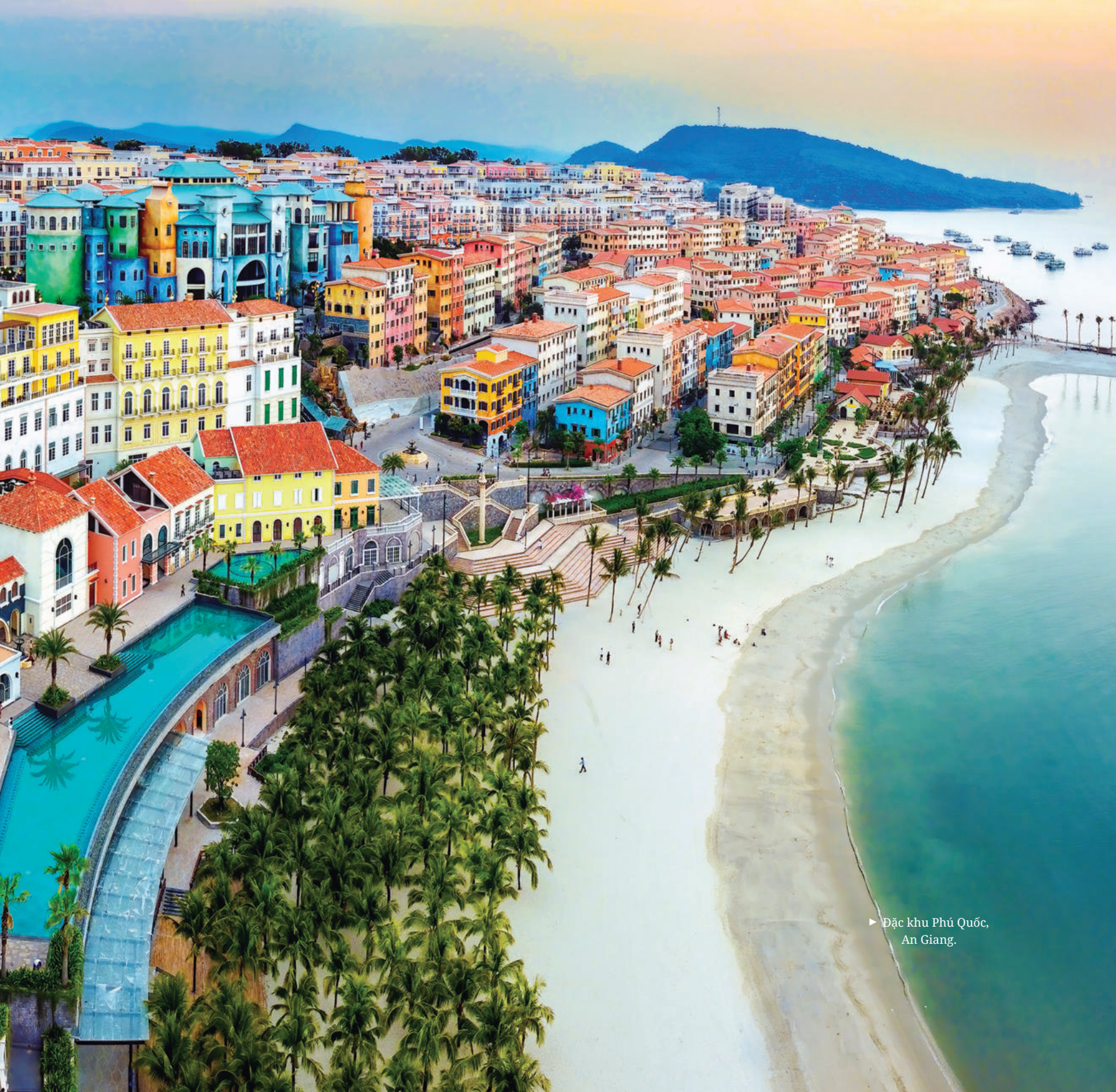
► Đặc khu Phú Quốc, An Giang.