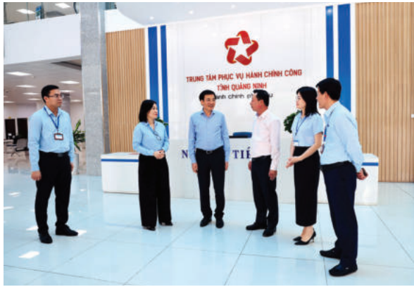
► Bộ trưởng, Chủ nhiệm Văn phòng Chính phủ Trần Văn Sơn trao đổi với lãnh đạo UBND tỉnh Quảng Ninh và lãnh đạo Trung tâm Phục vụ hành chính công tỉnh Quảng Ninh, ngày 13/11/2025.