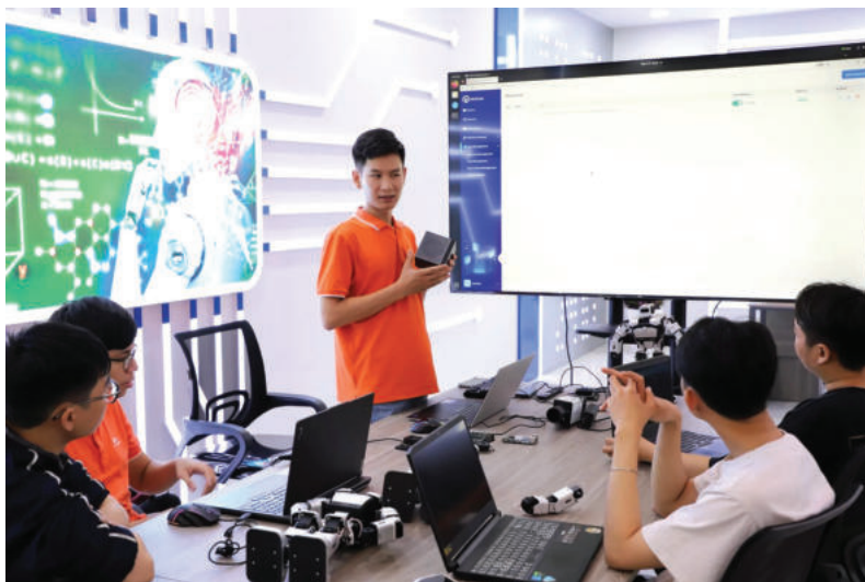
► Tỉnh Quảng Ninh phối hợp với Tập đoàn FPT đưa sinh viên về xã, phường hỗ trợ triển khai một số nhiệm vụ về công nghệ thông tin và chuyển đổi số.

Ba là, nâng cao chất lượng dịch vụ công và trải nghiệm của người dân: cần chuẩn hóa, tích hợp 100% TTHC trên