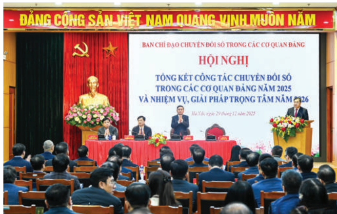
► Ủy viên Bộ Chính trị, Thường trực Ban Bí thư Trần Cẩm Tú, Trưởng ban Chỉ đạo Chuyển đổi số trong các cơ quan Đảng chủ trì Hội nghị, ngày 29/12/2025.

minh tham mưu. Tham mưu phải có tầm nhìn xa, trông rộng về đối tượng, về lĩnh vực được giao chủ trì tham mưu. Xa và rộng bao hàm cả không gian và thời gian vận động, phát triển của sự vật, của thực tiễn. Tầm nhìn xa của tư duy tham mưu thể hiện sự bao quát đúng quá khứ của sự vật, hiện tượng, thực tiễn, “hiểu đúng” được quy luật vận động hiện tại của sự vật, hiện tượng và trên cơ sở đó đưa ra dự báo đúng, trúng về xu hướng vận động, phát triển của sự vật, hiện tượng, của thực tiễn trong tương lai gần và tương lai xa. Trên cơ sở đó tham mưu cho lãnh đạo những quyết sách có tầm nhìn chiến lược.