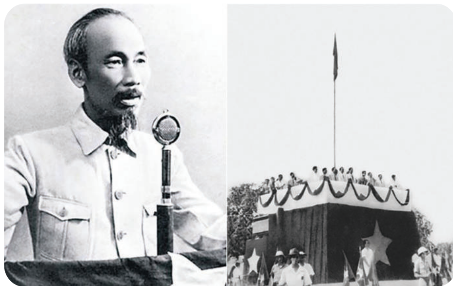
► Ngày 2/9/1945, tại Quảng trường Ba Đình, Hà Nội, Chủ tịch Hồ Chí Minh đọc bản Tuyên ngôn Độc lập, khai sinh ra nước Việt Nam Dân chủ Cộng hòa, mở ra kỷ nguyên mới cho lịch sử dân tộc.

và các tiền bối đi trước, vào ngày 05/6/1911, người thanh niên yêu nước Nguyễn Tất Thành đã rời bến Nhà Rồng ra đi tìm đường cứu nước với một hướng đi hoàn toàn mới mẻ và táo bạo. Hành trình cứu nước bốn ba qua nhiều đại dương, châu lục với nhiều trải nghiệm sâu sắc để rồi Người được tiếp xúc, giác ngộ chủ nghĩa Mác - Lênin để đi đến một kết luận khắc ghi vào lịch sử: “muốn cứu nước và giải phóng dân tộc không có con đường nào khác con đường cách mạng vô sản” (1) .