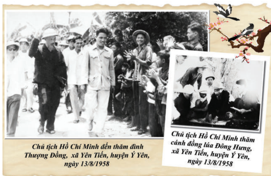
Chủ tịch Hồ Chí Minh đến thăm đình Thượng Đổng, xã Yên Tiến, huyện Ý Yên, ngày 13/8/1958