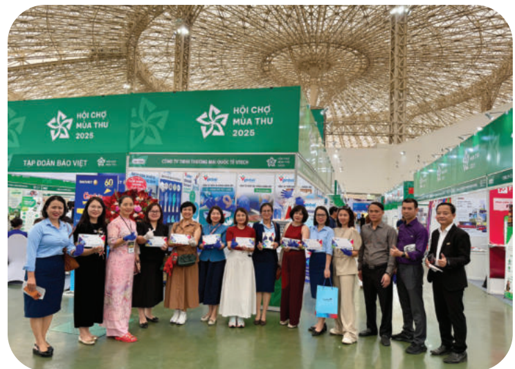
► Đại lý, đối tác tin tưởng hợp tác phân phối sản phẩm găng tay Vglobal tại Việt Nam.

Ở góc độ thị trường, VTECHCOM không chỉ dừng lại ở vai trò phân phối sản phẩm, mà hướng tới cung cấp giải pháp phù hợp với từng lĩnh vực sử dụng. Trong các ngành như chế biến thực phẩm xuất khẩu hay điện tử, việc lựa chọn thiết bị bảo hộ không đúng tiêu chuẩn có thể dẫn đến rủi ro về chất lượng sản phẩm, thậm chí ảnh hưởng đến uy tín của doanh nghiệp trên thị trường quốc tế. Vì vậy, khả năng tư vấn và đồng hành kỹ thuật đang trở thành một phần quan trọng trong năng lực cạnh tranh của đơn vị cung ứng.