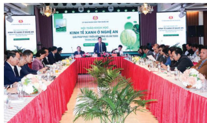
► UBND tỉnh Nghệ An tổ chức Hội thảo khoa học cấp tỉnh với chủ đề "Kinh tế xanh ở Nghệ An - Giải pháp phát triển bền vững và an toàn trong bối cảnh mới", ngày 26/11/2025.

Hệ thống thông tin thị trường lao động, việc làm chưa thực sự hoàn chỉnh; kết nối thị trường lao động trong nước và quốc tế còn yếu; độ bao phủ của mạng lưới an sinh xã hội còn hạn chế, chưa đạt hiệu quả cao; công tác thống kê, phân tích dữ liệu và dự báo thị trường còn hạn chế; phân bố lao động còn mất cân đối giữa các vùng, các ngành nghề; tính mùa vụ trong nông nghiệp còn lớn dẫn đến thiếu việc làm theo mùa vụ ở