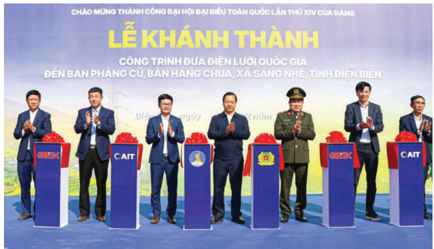
► Các đại biểu thực hiện nghi thức cắt băng khánh thành công trình đưa điện lưới quốc gia đến với bản Phẳng Cù và bản Háng Chua, xã Sáng Nhè (Điện Biên), ngày 06/02/2026.

Ngày 24/01/2025, Bộ Chính trị đã ban hành Nghị quyết số 59-NQ/TW về hội nhập quốc tế trong tình hình mới - đây chính là “quyết sách đột phá”, đánh dấu bước ngoặt có tính lịch sử trong quá trình hội nhập của đất nước với việc định vị hội nhập quốc tế là động lực quan trọng đưa đất nước bước vào kỷ nguyên mới (11) . Đồng thời, Nghị quyết số 59-NQ/TW cũng đánh dấu bước chuyển quan trọng của Đảng về tư duy và định hướng hội nhập quốc tế trong giai đoạn tới, tạo động lực đưa đất nước tiến tới đài vinh quang của độc lập, tự do, hạnh phúc, phồn thịnh, trường tồn.