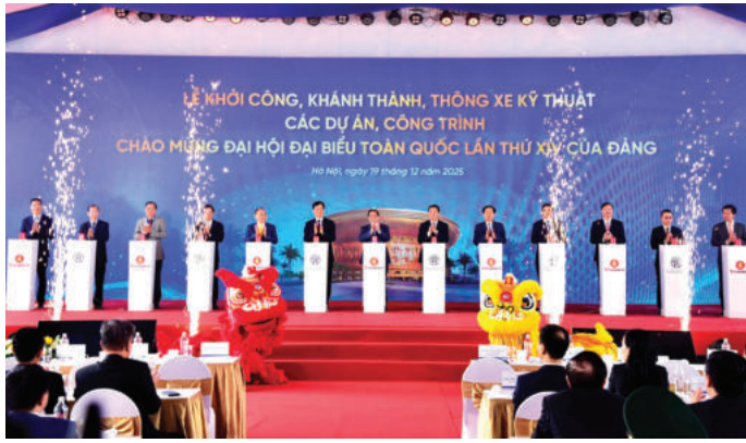
► Ủy viên Bộ Chính trị, Thủ tướng Chính phủ Phạm Minh Chính; Ủy viên Bộ Chính trị, Bí thư Thành ủy Hà Nội Nguyễn Duy Ngọc và các đại biểu thực hiện nghi thức khởi công, khánh thành, thông xe kỹ thuật, các dự án, công trình chào mừng Đại hội đại biểu toàn quốc lần thứ XIV của Đảng, ngày 19/12/2025.

thuận lợi, đặc biệt là đại dịch COVID-19, thiên tai, bão lũ; các rủi ro an ninh truyền thống và an ninh phi truyền thống; cạnh tranh chiến lược gay gắt; biến động, đứt gãy chuỗi cung ứng, năng lượng, lương thực; cùng với những vấn đề nội tại tích tụ qua nhiều năm, nhưng Đảng ta đã thể hiện bản lĩnh, năng lực lãnh đạo, cầm quyền và sức chiến đấu, tinh thần đoàn kết thống nhất; thể hiện ý chí, khát vọng phát triển, kiến tạo tương lai, tư duy đổi mới, hành động quyết liệt; toàn Đảng, toàn dân, toàn quân ta đã chung sức, đồng lòng thực hiện thắng lợi Nghị quyết Đại hội XIII của Đảng với nhiều kết quả rất quan trọng, toàn diện, đột phá, nhiều điểm sáng nổi bật, cơ bản hoàn thành các mục tiêu chủ yếu đề ra: nền kinh tế giữ vững ổn định vĩ mô, duy trì được đà tăng trưởng khá, bình quân giai đoạn 2021 - 2025 là 6,3%, riêng năm 2025 là 8,02%; tiềm lực, sức chống chịu và khả năng thích ứng được nâng lên, tạo nền tảng và dư địa quan trọng phát triển nhanh và bền vững hơn trong kỷ nguyên mới.