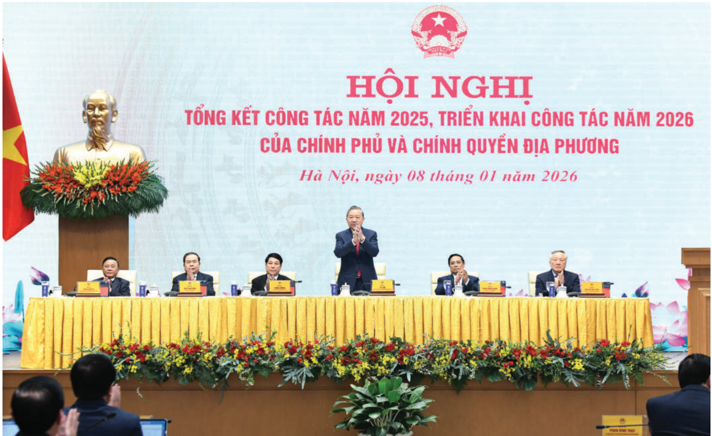
► Tổng Bí thư Tô Lâm và các đồng chí lãnh đạo Đảng, Nhà nước tham dự Hội nghị Tổng kết công tác năm 2025, triển khai công tác 2026 của Chính phủ và chính quyền địa phương, ngày 08/01/2026.