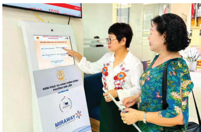
► Công chức tại Điểm tiếp nhận, phục vụ hành chính công phường Kim Liên, thành phố Hà Nội hướng dẫn người dân lấy số thực hiện thủ tục hành chính.

Thứ sáu, CQĐP và đội ngũ cán bộ, công chức, viên chức cần thực hiện tốt trách nhiệm của mình nhằm thúc đẩy quản trị địa phương tốt. Trên thực tế, thể chế liên quan đến các yếu tố của quản trị địa phương tốt ở nước ta tương đối đầy đủ, nhưng khâu yếu vẫn là việc thực hiện thể chế. Vì vậy, CQĐP và đội ngũ cán bộ, công chức, viên chức các cấp chính quyền địa phương cần thực hiện tốt trách nhiệm của mình, thực hiện tốt việc hợp tác, phối hợp với các tổ chức và doanh nghiệp trong thực thi chính sách và cung ứng dịch vụ công. 🐦