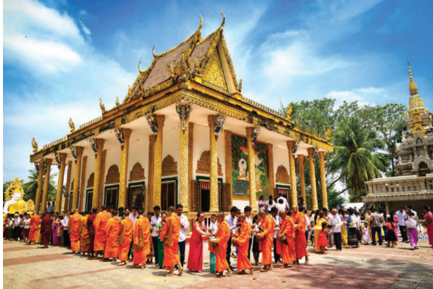
► Trong những năm qua, tình hình tôn giáo ở vùng Tây Nam Bộ cơ bản ổn định, các sinh hoạt tôn giáo đều diễn ra theo đúng quy định pháp luật.