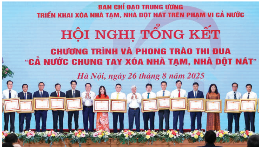
► Hội nghị trực tuyến tổng kết Phong trào thi đua “Cả nước chung tay xóa nhà tạm, nhà đột nát”, ngày 26/8/2025.

Đặc biệt, tại Đại hội lần thứ XIII, Đảng ta tiếp tục khẳng định xây dựng và bảo vệ vững chắc Tổ quốc Việt Nam xã hội chủ nghĩa là hai nhiệm vụ chiến lược của cách mạng Việt Nam. Để thực hiện có hiệu quả mục tiêu đó, Đảng xác định một trong các quan điểm chỉ đạo là: “Kết hợp sức mạnh dân tộc với sức mạnh thời đại; nêu cao ý chí độc lập, tự chủ, chủ động, tích cực hội nhập và nâng cao hiệu quả hợp tác quốc tế, phát huy tối đa nội lực, tranh thủ ngoại lực, trong đó nguồn lực nội sinh, nhất là con người là quan trọng nhất” (10) .