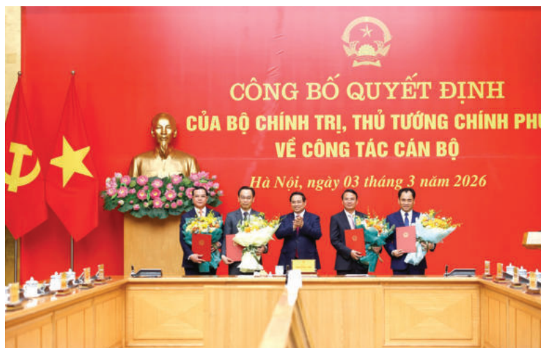
► Thủ tướng Chính phủ Phạm Minh Chính chủ trì Lễ công bố Quyết định của Bộ Chính trị và Thủ tướng Chính phủ về công tác cán bộ, ngày 03/3/2026.

Cán bộ tham mưu chiến lược lĩnh vực nào thì phải am hiểu sâu chuyên môn lĩnh vực mà mình phụ trách. Đặc biệt, phải am hiểu sâu sắc về chủ trương, đường lối của Đảng, chính sách, pháp luật của Nhà nước về lĩnh vực tham mưu. Cụ thể là: “a) Am hiểu về hệ thống tổ chức của Đảng, nguyên tắc tổ chức và hoạt động của Đảng, nắm chắc các văn bản hướng dẫn nghiệp vụ liên quan đến lĩnh vực công tác” (3) ; “b) Có năng lực tổ chức thực hiện các nhiệm vụ nghiên cứu, tham mưu, sơ kết, tổng kết, đề xuất, ban hành các chủ trương, nhiệm vụ, giải pháp của cấp ủy về công tác xây dựng Đảng, xây dựng hệ thống chính trị và nhiệm vụ chính trị theo lĩnh vực, chuyên môn được giao”;