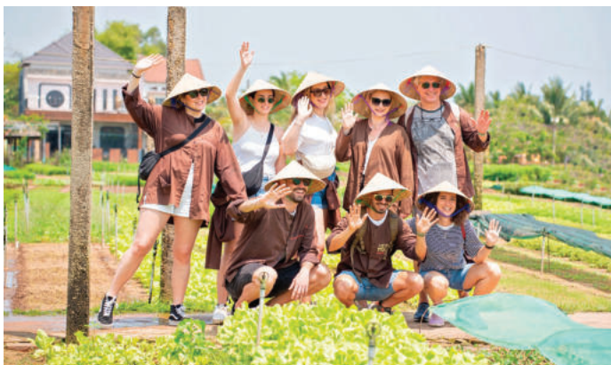
► Du lịch nông thôn góp phần thúc đẩy phát triển kinh tế xanh, bền vững.

Một là , nâng cao nhận thức về cơ hội và thách thức đối với thị trường lao động hiện nay khi tổ chức thực hiện các Nghị quyết nêu trên. Tiếp tục hoàn thiện thể chế, chính sách pháp luật đồng bộ, thống nhất để thị trường lao động phát triển theo hướng linh hoạt,