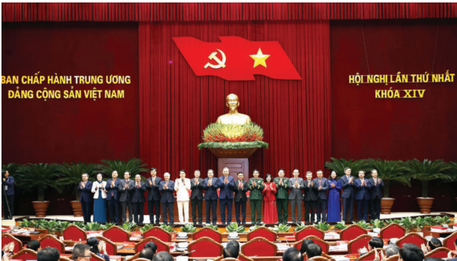
► Tổng Bí thư Tô Lâm cùng các đồng chí Ủy viên Bộ Chính trị, Ủy viên Ban Bí thư Trung ương Đảng khóa XIV ra mắt tại Hội nghị lần thứ nhất Ban Chấp hành Trung ương Đảng khóa XIV, ngày 23/01/2026.

1. Đại hội đại biểu toàn quốc lần thứ XIV của Đảng (Đại hội XIV) với phương châm “Đoàn kết - Dân chủ - Kỷ cương - Đột phá - Phát triển” là lời hiệu triệu, là mệnh lệnh của trách nhiệm trước lịch sử, đã thành công rất tốt đẹp. Chủ đề Đại hội XIV là “Dưới lá cờ vẻ vang của Đảng, chung sức, đồng lòng thực hiện thắng lợi các mục tiêu phát triển đất nước đến năm 2030; tự chủ chiến lược, tự cường, tự tin, tiến mạnh trong kỷ nguyên vươn mình của dân tộc, vì hòa bình, độc lập, dân chủ, giàu mạnh, phồn vinh, văn minh, hạnh phúc, vững bước đi lên chủ nghĩa xã hội”, thể hiện tư tưởng và khát vọng lớn, không chỉ định ra mục tiêu cho nhiệm kỳ 2026 - 2031, mà còn vạch ra mục tiêu mang tầm chiến lược đối với tương lai và vận mệnh của dân tộc trong nhiều thập niên tới.