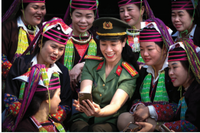
► Cán bộ công an với công tác chuyển đổi số nơi vùng cao biên giới.

Từng bước chú trọng tới khoảng cách số (Digital Divide), như làm giảm đi sự bất bình đẳng giữa thành thị và nông thôn, giữa những người thuộc thế hệ trẻ thành thạo công nghệ thông tin và những người thuộc thế hệ lớn tuổi, người nghèo trong việc tiếp cận các dịch vụ số. Thực hiện việc đảm bảo internet tốc độ cao và smartphone đến vùng sâu, vùng xa; từng bước cụ thể hóa các quy định về an ninh mạng và quyền riêng tư, như nguy cơ rò rỉ dữ liệu cá nhân, lừa đảo trực tuyến và sự xâm nhập của các thông tin độc hại, tin giả hay những vấn đề về xung đột văn hóa và đạo đức, như về đạo đức AI, sự cô lập xã hội do quá phụ thuộc vào thế giới ảo và sự xói mòn các giá trị truyền thống. Hình thành các trung tâm điều hành thông minh nhằm tăng cường giám sát an ninh mạng, ứng cứu sự cố và ngăn chặn tin tặc, tin giả kịp thời hiệu quả.