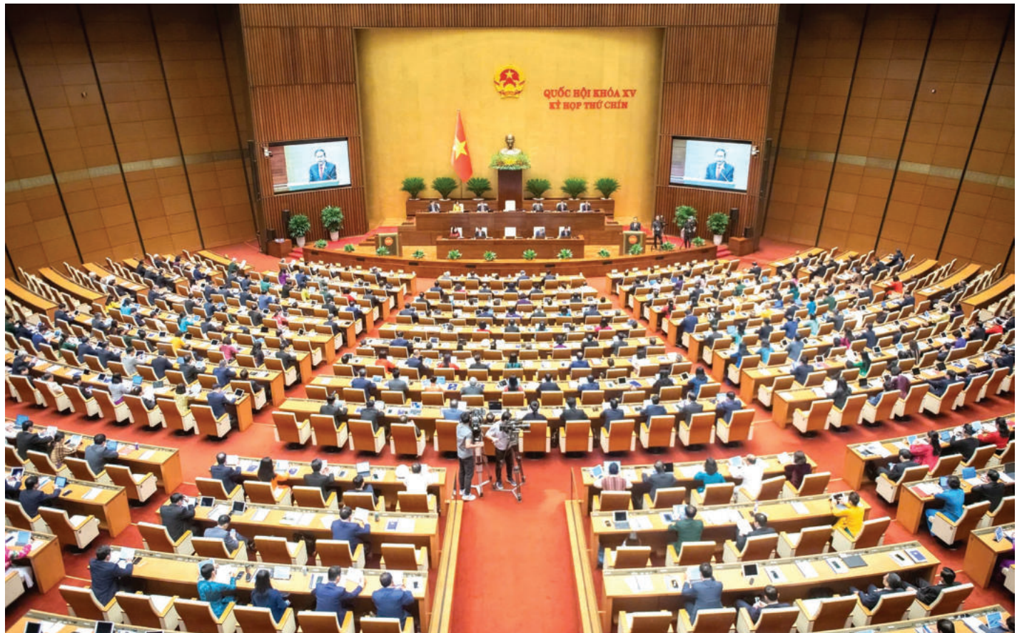
► Biểu quyết thông qua Luật Tổ chức chính quyền địa phương (sửa đổi), tại Kỳ họp thứ 9, Quốc hội khóa XV, ngày 16/6/2025.