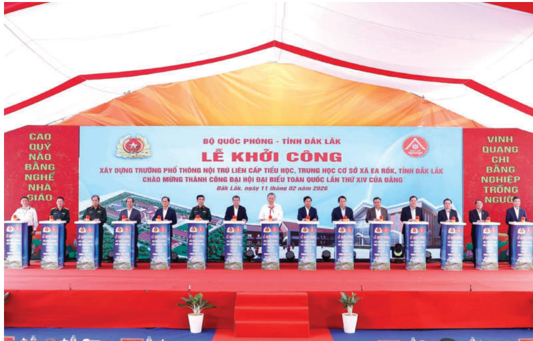
► Tổng Bí thư Tô Lâm dự Lễ khởi công xây dựng Trường Phổ thông nội trú liên cấp tiểu học, trung học cơ sở xã Ea Rók (tỉnh Đắk Lắk), do Bộ Quốc phòng phối hợp với UBND tỉnh Đắk Lắk tổ chức, ngày 11/02/2026.

Nguyên giảng viên cao cấp, Học viện Hành chính và Quản trị công