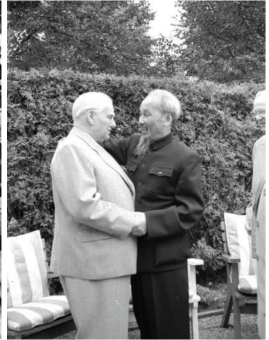
► Chủ tịch Hồ Chí Minh và Chủ tịch nước Cộng hòa Dân chủ Đức Wilhelm Pieck, ngày 25/7/1957.

Năm 1943, dưới sự chỉ đạo của Người, tại các vùng căn cứ địa cách mạng đã lập ra các Ủy ban nhân dân cách mạng tỉnh và liên tỉnh. Nói về tính chất của Ủy ban dân tộc giải phóng Việt Nam được thành lập tại Tân Trào (năm 1945), Người viết: “Ủy ban dân tộc giải phóng Việt Nam cũng như Chính phủ lâm thời của ta lúc này” (11) . Đó chính là hình thức tiền thân của nhà nước Việt Nam kiểu mới mà Người đã lựa chọn qua 30 năm tìm đường cứu nước, giải phóng dân tộc. Chương trình Việt Minh cũng nhấn mạnh: sau khi đánh đuổi được đế quốc Pháp, phát xít Nhật, sẽ thành lập một Chính phủ nhân dân của nước Việt Nam Dân chủ Cộng hòa. Hình thức tiền thân của pháp luật kiểu mới mà lãnh tụ Nguyễn Ái Quốc - Hồ Chí Minh phác họa được thể hiện trong Chương trình Việt Minh, theo đó, cách mạng Việt Nam sẽ thắng lợi, một nước Việt Nam dân chủ cộng hòa chân chính dân chủ sẽ xuất hiện. Cách mạng dân tộc giải phóng thành công, chúng ta sẽ thi hành bản Chương trình vĩ đại trên đây. Các nhà khoa học cho rằng đó là những hình thức tiền thân để xây dựng, phát triển hệ thống pháp luật Việt Nam sau này: “Mặt trận Việt Minh đưa ra 10 chính sách lớn, có thể nói đó là mầm mống pháp luật của chế độ mới” (12) ; “Chương trình Việt Minh có thể coi là cơ sở xây dựng bản Hiến pháp đầu tiên của nước ta” (13) .