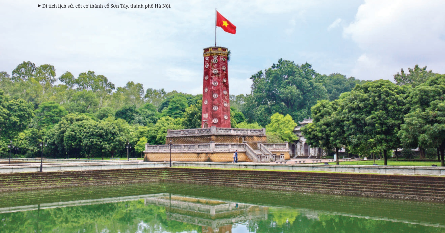
► Di tích lịch sử, cột cờ thành cổ Sơn Tây, thành phố Hà Nội.