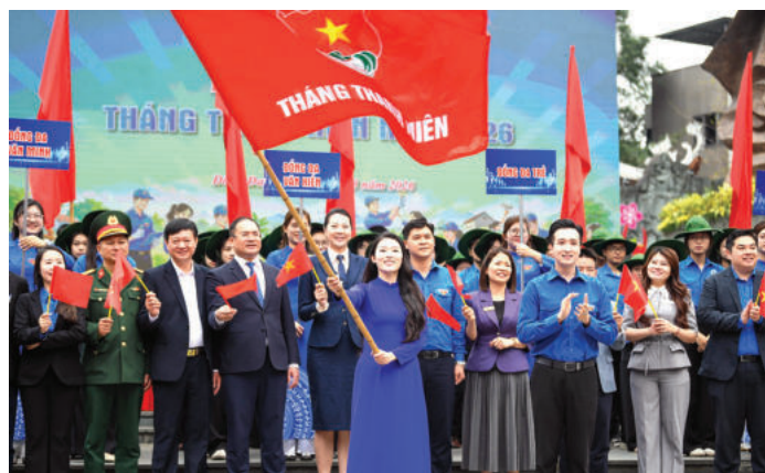
► Lực lượng đoàn viên, thanh niên, sinh viên ra quân hỗ trợ người dân làm thủ tục online, tham gia chuẩn bị bầu cử.

Từ thực tiễn phối hợp công tác giữa MTTQ Việt Nam và các tổ chức chính trị - xã hội với cơ quan nhà nước nhằm thực hiện quyền làm chủ của Nhân dân thời gian qua, có thể rút ra một số kinh nghiệm quan trọng. Trước hết , phối hợp công tác phải đặt lợi ích, nguyện vọng chính đáng và hợp pháp của Nhân dân làm mục tiêu cao nhất, mọi hoạt động cần được đánh giá bằng mức độ hài lòng của Nhân dân; Thứ hai , quy chế phối hợp phải rõ ràng, cụ thể, xác định “ai làm gì, làm như thế nào, chịu trách nhiệm ra sao”, để tránh chồng chéo, né tránh hoặc đùn đẩy trách nhiệm; Thứ ba , phương thức phối hợp cần đa dạng, linh hoạt, gắn với ứng dụng công nghệ thông tin, bảo đảm sự tương tác nhanh chóng, minh bạch, công khai giữa cơ quan nhà nước, MTTQ, các tổ chức chính trị - xã hội và Nhân dân; Thứ tư , cần nâng cao chất lượng đội ngũ cán bộ tham gia phối hợp, bởi con người là nhân tố quyết định sự thành công của cơ chế phối hợp. Thứ năm , công tác phối hợp giữa MTTQ, các tổ chức chính trị - xã hội với cơ quan nhà nước đã tạo được nền tảng quan trọng trong việc phát huy dân chủ, thực hiện