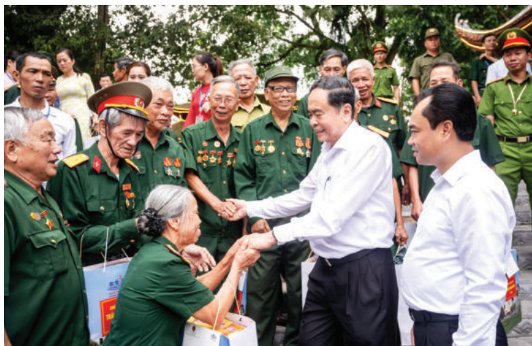
► Ủy viên Bộ Chính trị, Chủ tịch Quốc hội Trần Thanh Mẫn thăm hỏi, tặng quà thương binh, bệnh binh, thân nhân liệt sĩ và người có công với cách mạng tỉnh Thái Nguyên, ngày 27/7/2025.

Hiện nay, trong bối cảnh quốc tế cũng như tình hình trong nước có nhiều diễn biến thay đổi nhanh chóng; có nhiều bất ổn, bất định, phức tạp, khó dự báo, khó khăn, thách thức nhiều hơn thuận lợi, xuất hiện những thay đổi mang tính thời đại, nhiều vấn đề rất mới, cuộc Cách mạng công nghiệp lần thứ tư diễn ra nhanh, sâu sắc và toàn diện, nhất là trí tuệ nhân tạo; các vấn đề an ninh