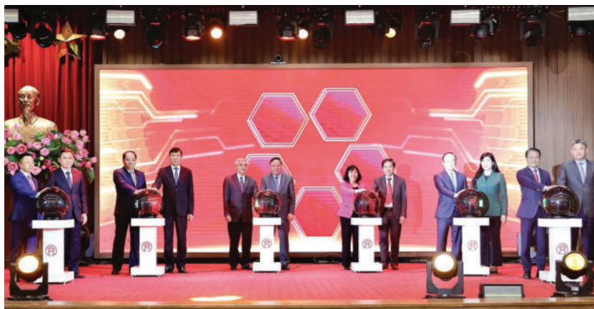
► Các đại biểu bấm nút khai trương các ứng dụng chuyển đổi số dùng chung ba cấp trong các cơ quan Đảng, Chính quyền, Đoàn thể thành phố Hà Nội, ngày 03/3/2025.

Để xây dựng và vận hành CQĐP số, cần thống nhất về nhận thức và quán triệt các yêu cầu sau: