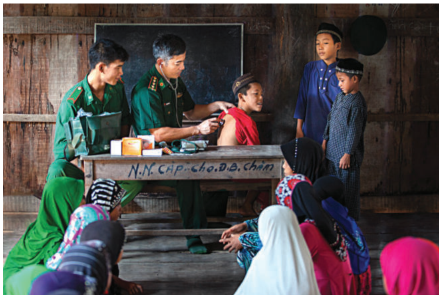
► Bác sĩ quân hàm xanh khám, chữa bệnh cho người dân.

Từ quan niệm của UNDP có thể khái quát cách hiểu chung nhất về an ninh con người là việc bảo đảm an toàn cho con người trên tất cả các lĩnh vực của đời sống xã hội, đáp ứng đầy đủ những nhu cầu tối thiểu về vật chất và tinh thần để con người có thể sống, phát triển trong điều kiện bình thường.