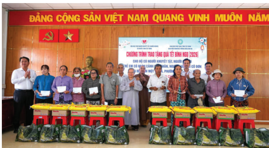
► Lãnh đạo tỉnh Tây Ninh, Hội Bảo trợ người khuyết tật, người nghèo và bảo vệ quyền trẻ em tỉnh Tây Ninh cùng đại diện Ban Điều hành hệ thống chùa Núi Bà Tây Ninh trao quà Tết cho người dân có hoàn cảnh khó khăn tại xã Mỹ Quý, tỉnh Tây Ninh.

Về tôn giáo: trong Vùng hiện có 13 tôn giáo được công nhận tư cách pháp nhân và một số tổ chức tôn giáo chưa được công nhận tư cách pháp nhân vẫn đang hoạt động. Trong những năm qua, tình hình tôn giáo cơ bản ổn định, các sinh hoạt tôn giáo đều diễn ra theo đúng quy định pháp luật. Tuy nhiên, vẫn còn một số vấn đề nảy sinh trong đồng bào tôn giáo tiềm ẩn những yếu tố phức tạp, đe dọa đến việc bảo đảm an ninh cá nhân, an ninh cộng đồng và an ninh chính trị trong Vùng.