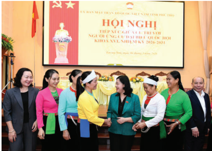
► Ủy viên Bộ Chính trị, Bí thư Trung ương Đảng, Bí thư Đảng ủy MTTQ, các đoàn thể Trung ương, Chủ tịch Ủy ban Trung ương MTTQ Việt Nam Bùi Thị Minh Hoài tiếp xúc cử tri xã Lương Sơn, tỉnh Phú Thọ, ngày 06/3/2026.

Việc giám sát không chỉ dừng lại ở kiểm tra trên văn bản, mà phải dựa vào kết quả cụ thể: ý kiến Nhân dân có được giải quyết kịp thời không, quyền và lợi ích hợp pháp của người dân có được bảo đảm không, niềm tin xã hội có được củng cố hay không.