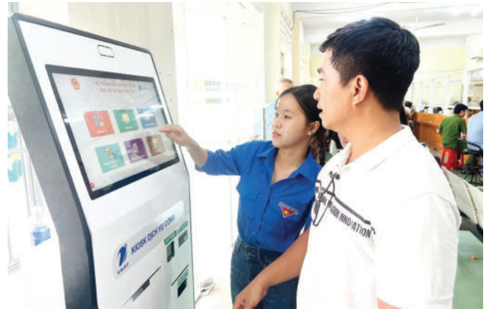
► Cán bộ phường Bình Hưng Hòa hướng dẫn người dân làm thủ tục hành chính tại Trung tâm Phục vụ hành chính công.

Có thể thấy, việc vận dụng chính quyền số vào quản trị đô thị đang đem lại những chuyển biến tích cực trên nhiều mặt, hiệu quả hơn trong quản lý, minh bạch hơn trong cung cấp dịch vụ và gắn kết hơn với cộng đồng dân cư. Tuy quá trình này còn mới và nhiều thách thức (đặc biệt về hạ tầng và nhân lực), nhưng kết quả tại các địa phương nêu trên đã cho thấy tiềm năng to lớn của chính quyền số trong việc giải quyết các bài toán đô thị. Đứng trước tốc độ đô thị