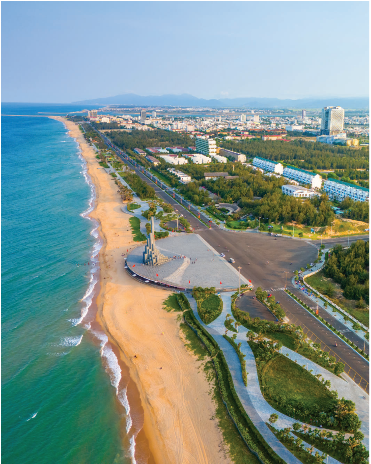
► Tháp Nghinh Phong, Đắk Lắk.