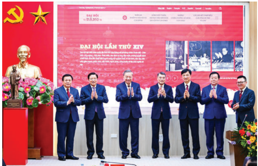
► Tổng Bí thư Tô Lâm chủ trì, chỉ đạo Lễ ra mắt Trang thông tin điện tử chuyên đề Đảng Cộng sản Việt Nam Đại hội lần thứ XIV, ngày 12/9/2025.

Trên nhiều kênh thông tin, nhất là các trang mạng xã hội, các thế lực thù địch thường xuyên đưa ra các luận điệu: phủ nhận những thành tựu mà đất nước và Nhân dân ta đạt được dưới sự lãnh đạo của Đảng; yêu cầu xóa bỏ vai trò lãnh đạo của Đảng tại Điều 4 Hiến pháp năm 2013; cổ xúy tư tưởng đòi đa đảng, thực hiện tam quyền phân lập ở nước ta... Họ cho rằng, Đảng Cộng sản Việt Nam không thể đưa đất nước vào kỷ nguyên mới; Đảng đã chọn sai con đường, không thể có chủ nghĩa xã hội trong hiện thực, khuyến khích chúng ta nên từ bỏ con đường xã hội chủ nghĩa, từ bỏ chủ nghĩa Mác - Lênin để đi theo con đường tư bản chủ nghĩa, bởi vì thực tế chưa có một nước nào quá độ lên chủ nghĩa xã hội thành công mà không qua giai đoạn phát triển tư bản chủ nghĩa. Từ đó, đòi xóa bỏ quyền lãnh đạo của Đảng, phủ nhận mục tiêu lý tưởng đạo đức cao đẹp của Đảng.