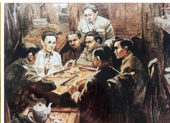
► Tranh vẽ đồng chí Nguyễn Ái Quốc chủ trì Hội nghị thành lập Đảng Cộng sản Việt Nam (từ ngày 03/01 đến ngày 07/02/1930, ở bán đảo Cửu Long thuộc Hương Cảng, Trung Quốc.