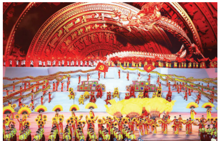
► Chương trình nghệ thuật đặc biệt “Dưới lá cờ vẻ vang của Đảng” được tổ chức trọng thể, chào mừng thành công Đại hội đại biểu toàn quốc lần thứ XIV, ngày 23/01/2026.

Tư tưởng xuyên suốt trong Văn kiện và cũng là cội nguồn sức mạnh của cách mạng Việt Nam là “Dân là gốc”. Nhân dân là trung tâm, là chủ thể, là mục tiêu, là động lực và là nguồn lực của phát triển. Mọi đường lối, chính sách phải hướng tới nâng cao đời sống vật chất và tinh thần của Nhân dân; bảo đảm quyền làm chủ của Nhân dân; tôn trọng, lắng nghe và dựa vào Nhân dân. Đảng phải gắn bó mật thiết với Nhân dân, tận tâm phục vụ Nhân dân, chịu sự giám sát của Nhân dân, chịu trách nhiệm trước Nhân dân về mọi quyết định của mình. Niềm tin của Nhân dân đối với Đảng không đến từ lời nói, mà đến từ việc làm, từ sự công tâm, liêm chính của cán bộ, từ hiệu quả của bộ máy, từ sự công bằng trong thụ hưởng, từ kết quả bảo vệ quyền