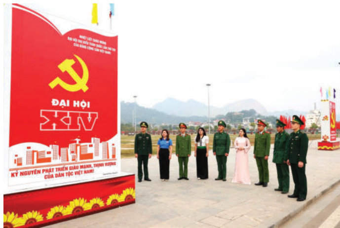
► Đồng bào các dân tộc tỉnh Sơn La kỷ vọng lớn vào Đại hội đại biểu toàn quốc lần thứ XIV của Đảng.

không chỉ do chính lịch sử dân tộc và khát vọng của Nhân dân Việt Nam quy định, mà còn do chính bản chất cách mạng, tính tiên phong, gương mẫu của Đảng. Vai trò và mối quan hệ đó đã được khẳng định trong thực tiễn lịch sử Việt Nam suốt hơn 90 năm qua, không ai có thể bác bỏ.