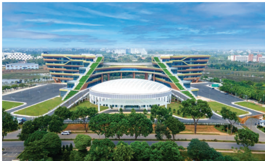
► Trung tâm Đổi mới sáng tạo quốc gia tại Hòa Lạc.

Tóm lại, kinh nghiệm của Trung Quốc cho thấy để vững bước trong kỷ nguyên mới, điều không thể trì hoãn là chuyển đổi mô hình quản trị quốc gia - từ quản trị “hành chính” sang quản trị “dựa trên dữ liệu - công nghệ - tiêu chuẩn”. Việt Nam có thể lựa chọn đối chiếu, chọn lọc triển khai phù hợp với điều kiện của mình, với mục tiêu cuối cùng là xây dựng nền quản trị quốc gia hiện đại - hiệu quả - xanh - số và bền vững, đưa đất nước bước vào kỷ nguyên mới, phát triển bền vững, phồn thịnh, Nhân dân ấm no, hạnh phúc. 🌱