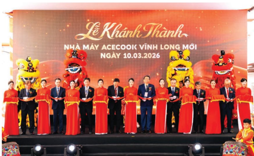
► Nghi thức cắt băng khánh thành nhà máy Acecook Vĩnh Long mới.

Với tổng vốn đầu tư hơn 200 triệu USD, nhà máy Acecook Vĩnh Long mới là mảnh ghép đặc biệt - đánh dấu bước mở rộng năng lực sản xuất của Công ty Cổ phần Acecook Việt Nam với tầm nhìn phát triển bền vững và vươn tầm thế giới.