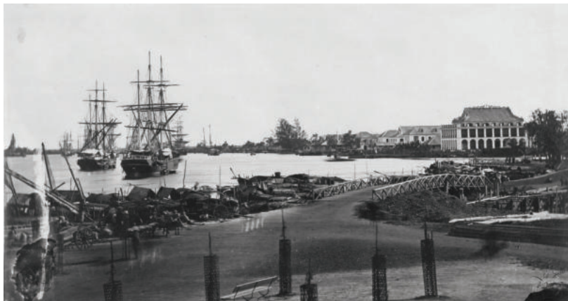
► Ngày 05/6/1911, từ bến cảng Nhà Rồng, người thanh niên yêu nước Nguyễn Tất Thành rời Tổ quốc, ra đi trên con tàu Amiral Latouche Tréville để thực hiện hoài bão giải phóng nước nhà khỏi ách nô lệ của thực dân, đế quốc.