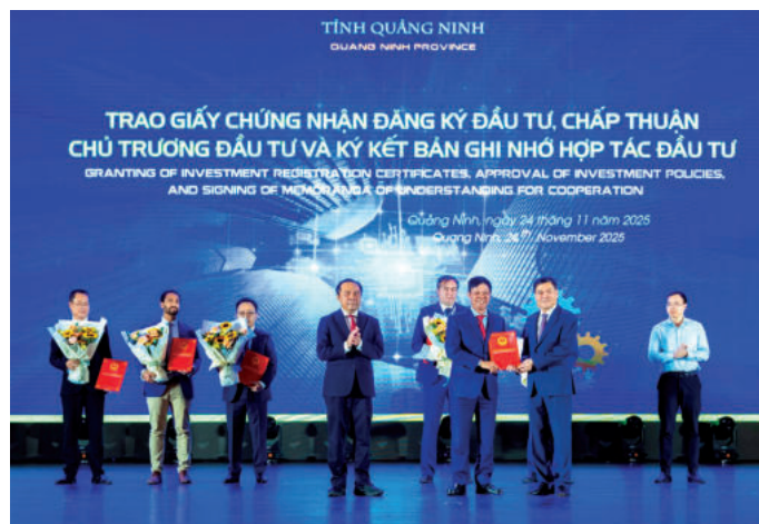
► Đại diện Tập đoàn FPT nhận chứng nhận đăng ký đầu tư dự án xây dựng Khu Công nghệ số tập trung và khu phụ trợ tại tỉnh Quảng Ninh, ngày 24/11/2025.

Năm 2024, Hàn Quốc là quốc gia đứng thứ tư trên thế giới trong bảng xếp hạng Chỉ số EGDI và dẫn đầu thế giới về Chỉ số tham gia điện tử (EPI) trong giai đoạn 2010 - 2020. Hàn Quốc xây dựng chiến