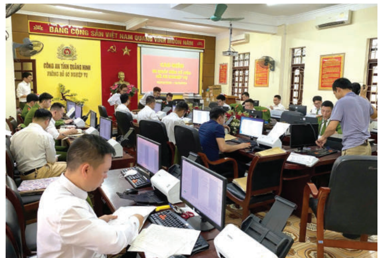
► Công an tỉnh Quảng Ninh dồn lực trong chiến dịch cao điểm 90 ngày đêm số hóa hồ sơ nghiệp vụ.

Thứ ba, mọi công nghệ và chính sách phải lấy người dân, doanh nghiệp làm trung tâm: sự thành công của chính quyền thông minh được đo lường bằng mức độ hài lòng và trải nghiệm của người dùng. Do đó, các ứng dụng công nghệ thường xuyên cải tiến dựa trên nhu cầu, cảm xúc, mong muốn của người dùng và sự phù hợp với điều kiện thực tiễn.