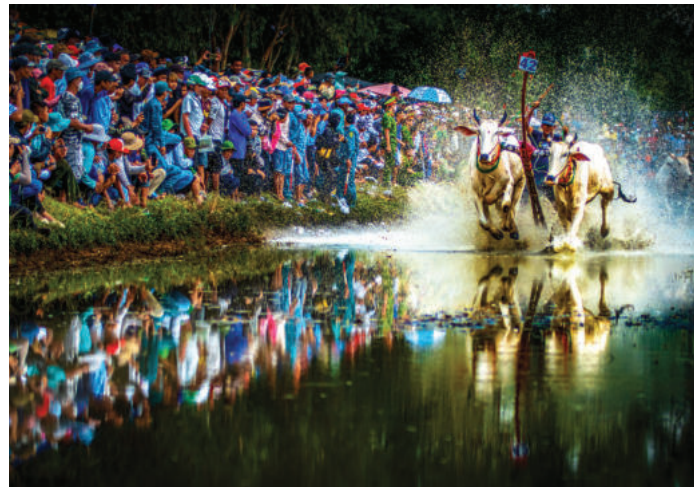
► Hội Đua bò Bảy Núi là lễ hội truyền thống độc đáo của đồng bào dân tộc Khmer ở tỉnh An Giang.

► Cầu Mỹ Thuận 1 và Mỹ Thuận 2 bắc qua sông Tiền, nối liền tỉnh Đồng Tháp và tỉnh Vĩnh Long.