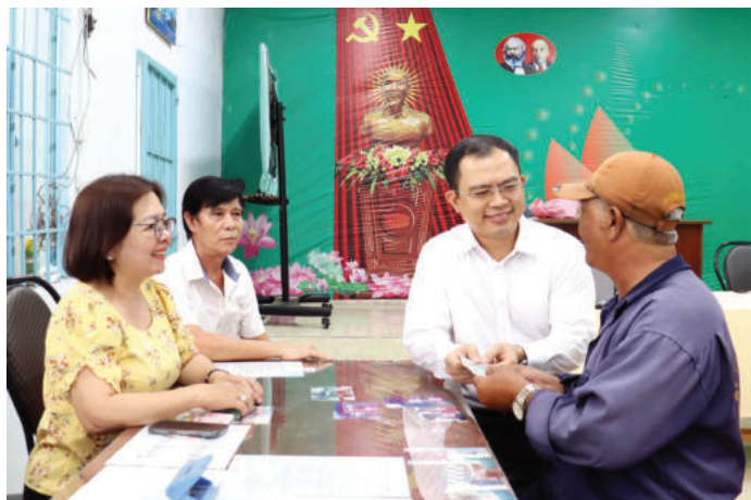
► Người dân xã Long Thành, tỉnh Đồng Nai, vui mừng khi nhận được quà của Đảng và Nhà nước trao tặng dịp Quốc khánh 02/9.