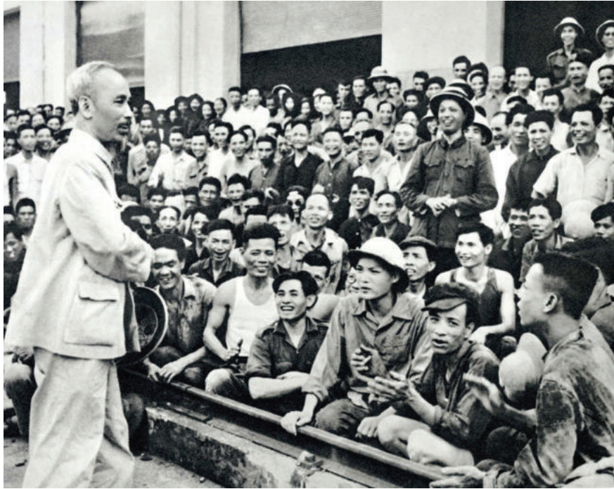
► Chủ tịch Hồ Chí Minh thăm Nhà máy xe lửa Gia Lâm, năm 1955.