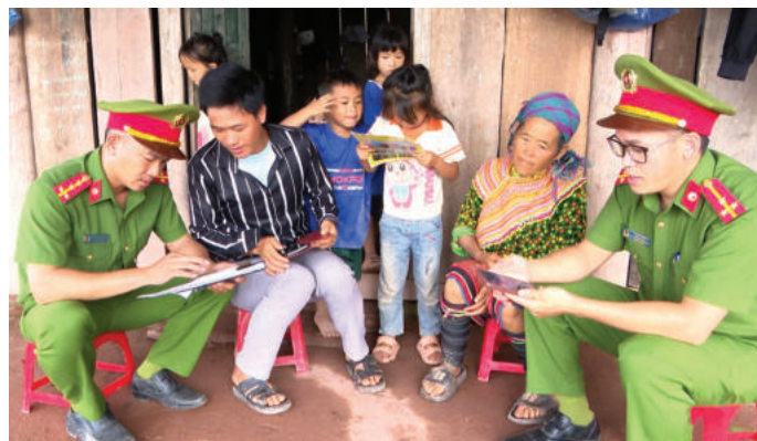
► Công an xã Nà Bùng, tỉnh Điện Biên tuyên truyền người dân cảnh giác trước các thông tin xấu trước thềm Đại hội đại biểu toàn quốc lần thứ XIV của Đảng.

Giữ vững nền tảng đạo đức của Đảng chính là giữ vững linh hồn của cách mạng, là bảo vệ bản chất, sức mạnh, uy tín và niềm tin của Đảng Cộng sản Việt Nam - đội tiên phong của giai cấp công nhân, Nhân dân lao động và dân tộc Việt Nam. Mỗi cán bộ, đảng viên phải nhận thức sâu sắc rằng: đạo đức là gốc của người cách mạng; xây dựng Đảng về đạo đức chính là xây dựng Đảng trong sạch, vững mạnh, đủ năng lực lãnh đạo nhân dân vượt qua mọi khó khăn, thử thách, thực hiện thắng lợi Nghị quyết Đại hội XIV của Đảng, đưa đất nước bước vào giai đoạn phát triển mới, hùng cường và thịnh vượng. 🍀