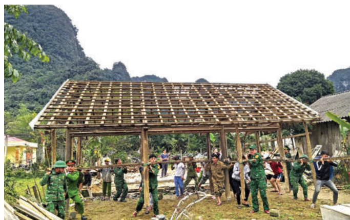
► Chiến sĩ Đồn Biên phòng Cà Xèng (Bộ đội biên phòng tỉnh Quảng Bình), huy động nhân, vật lực giúp Nhân dân xóa nhà tạm.

Với bản lĩnh cách mạng vững vàng và xuất phát từ thực tiễn đất nước, luôn đặt lợi ích dân tộc và Nhân dân lao động lên hàng đầu,