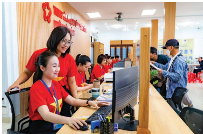
► Cán bộ trung tâm Phục vụ hành chính công phường Hòa Cường, thành phố Đà Nẵng hỗ trợ người dân thực hiện thủ tục hành chính.

Tuy nhiên, để biến tiềm năng thành hiện thực, yếu tố con người - nguồn nhân lực chất lượng cao - sẽ là chìa khóa quyết định sự thành công. Không có đội ngũ cán bộ, công chức giỏi, tận tụy, có năng lực và tâm nhin, mọi kế hoạch phát triển, dù tham vọng đến đâu cũng khó có thể thành hiện thực.