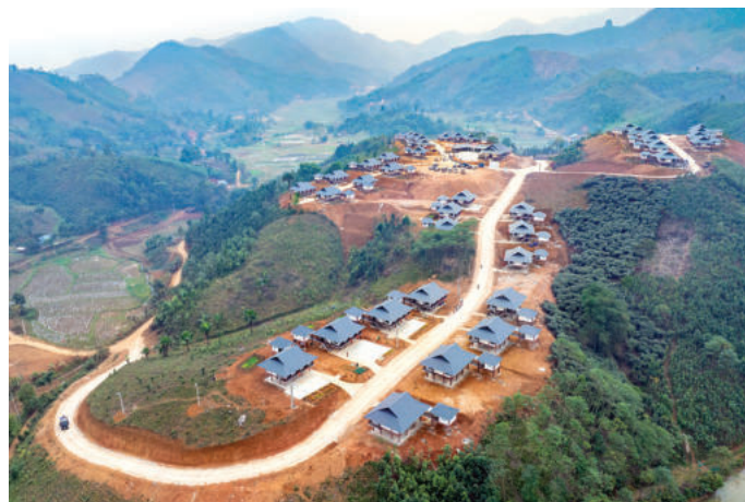
► Khu tái định cư Làng Nữ được quy hoạch và xây dựng trên đỉnh Đồi Sim, cách nơi xảy ra trận lũ quét và sạt lở đất thôn Làng Nữ cũ khoảng 2km.

Bốn là , chú trọng vấn đề quản trị phát triển xã hội trên nền tảng số trong bối cảnh hiện nay. Cần tổ chức nghiên cứu, xây dựng, triển khai hoạt động quản trị phát triển xã hội trên nền tảng số trong việc phát triển sử dụng công nghệ số (AI, Big Data, IoT, iCloud...) để điều hành, tổ chức và giải quyết các vấn đề xã hội nhằm hướng tới sự công bằng, bền vững và nâng cao chất lượng sống của người dân, của cộng đồng, xã hội. Từng bước thúc đẩy việc kết nối liên thông giữa các bộ, ngành về cơ sở dữ liệu dân cư, đất đai, bảo hiểm... để phục vụ quản trị hiệu quả. Thực hiện những hoạt động này không chỉ là số hóa giấy tờ, mà chú trọng tới thay đổi phương thức vận hành xã hội, là việc cung cấp dịch vụ công trực tuyến, như cung cấp các tiện ích như y tế số (telemedicine), giáo dục số (e-learning) và hành chính công không tiếp xúc. Đồng thời, từng bước thực hiện quản trị dựa trên dữ liệu (Data-driven), như sử dụng dữ liệu lớn để dự báo xu hướng xã hội, từ biến động thị trường lao động đến nguy cơ dịch bệnh hoặc tệ nạn xã hội. Chú trọng phát triển an sinh xã hội thông minh, như hệ thống chi trả trợ cấp, quản lý bảo hiểm xã hội và nhận diện đối tượng yếu thế thông qua định danh điện tử (e-ID).