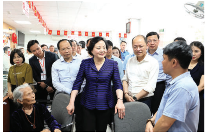
► Bí thư Trung ương Đảng, Phó Thủ tướng Chính phủ Phạm Thị Thanh Trà lắng nghe ý kiến của người dân phường Thành Sen, tỉnh Hà Tĩnh về thực hiện thủ tục hành chính, ngày 28/02/2026.

Thứ ba, nguyên tắc pháp quyền. Pháp quyền là một trong những đặc trưng cốt lõi của quản trị địa phương tốt. Trong quản trị địa phương tốt, pháp quyền có nghĩa là mọi hoạt động của tổ chức, pháp nhân và cá nhân, nhất là hoạt động của hệ thống chính trị, của CQĐP, cán bộ, công chức và viên chức đều phải theo pháp luật; quyền công dân đều được tôn trọng và bảo đảm một cách đầy đủ; pháp luật là chuẩn mực cao nhất trong quản trị địa phương. Ở cấp độ địa phương, tiêu chí đánh giá nguyên tắc pháp quyền gồm: sự tuân thủ pháp luật của