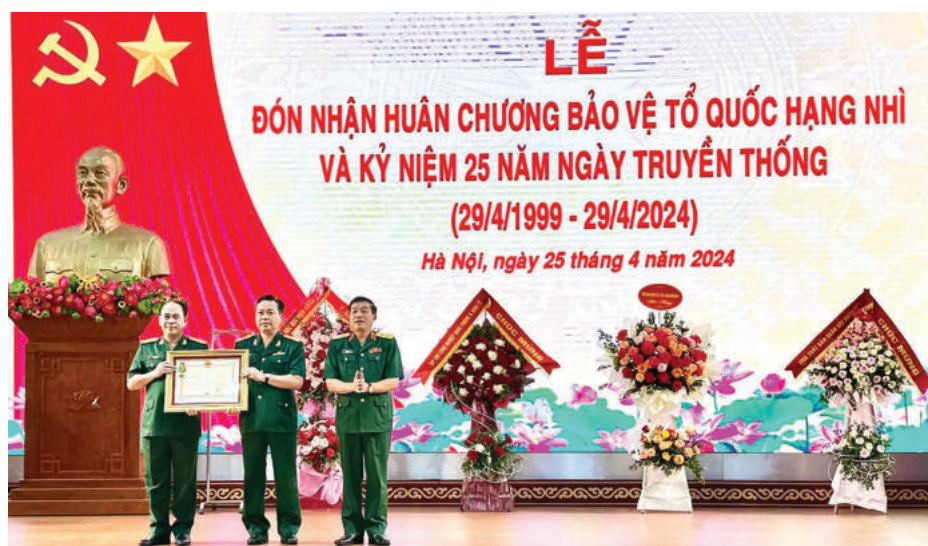
► Viện Khoa học xã hội và Nhân văn quân sự đón nhận Huân chương Bảo vệ Tổ quốc hạng Nhì, ngày 25/4/2024.

bị lợi dụng để lan truyền thông tin sai trái, xuyên tạc, chống phá cuộc bầu cử, phủ nhận vai trò lãnh đạo của Đảng và bản chất dân chủ của chế độ ta.