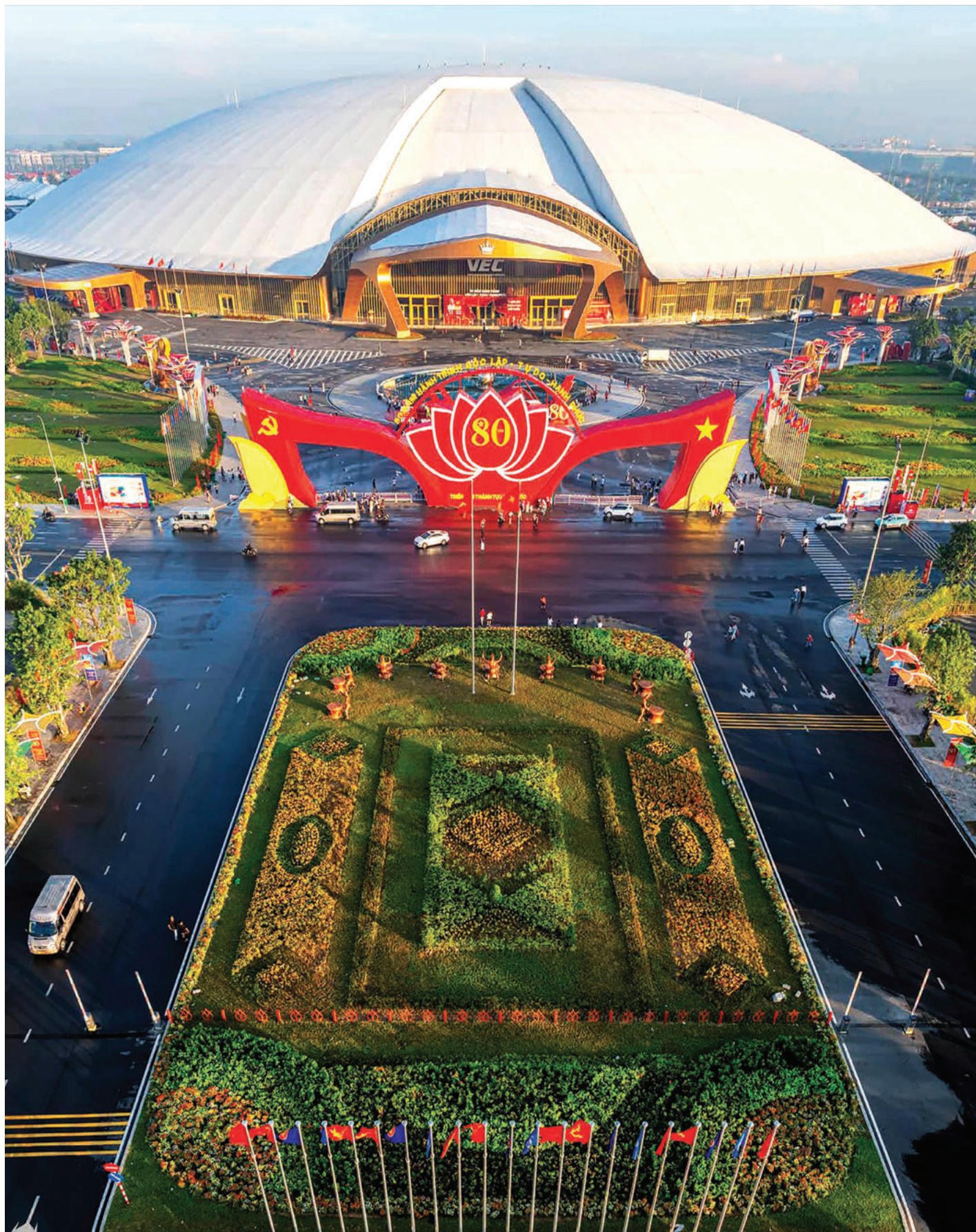
► Trung tâm Triển lãm Việt Nam (Hà Nội).