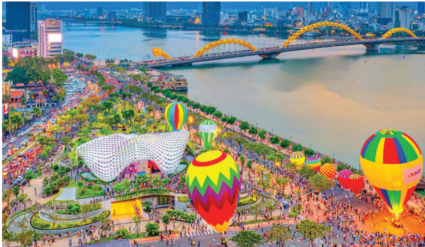
► Thành phố Đà Nẵng trên đường đổi mới và hội nhập và phát triển.

Thực hiện Nghị quyết số 202/2025/QH15 ngày 12/6/2025 của Quốc hội khóa XV về sáp nhập tỉnh Quảng Nam với thành phố Đà Nẵng đã đặt thành phố Đà Nẵng (mới) trước nhiều cơ hội và thách thức. Với kinh nghiệm đã có trong thời gian triển khai thí điểm chính quyền đô thị, cùng tiềm năng từ việc mở rộng không gian phát triển, thành phố Đà Nẵng đang tập trung xây dựng đội ngũ nhân lực - yếu tố “then chốt” hướng tới một nền hành chính hiện đại, chuyên nghiệp, hiệu quả và gần dân theo mô hình chính quyền địa phương 02 cấp.