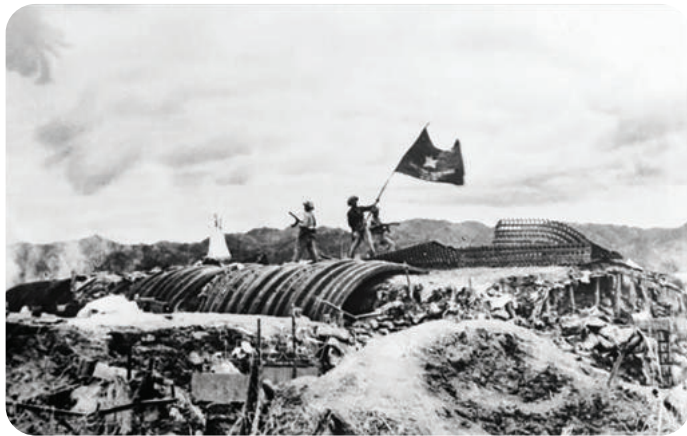
► Thắng lợi vĩ đại của Chiến dịch Điện Biên Phủ năm 1954 do nhiều nhân tố tạo thành, trong đó nhân tố có ý nghĩa quyết định, là sự lãnh đạo tuyệt đối, trực tiếp, đúng đắn và sáng suốt của Đảng Lao động Việt Nam.

Chủ tịch Hồ Chí Minh cùng toàn thể Nhân dân Việt Nam đã nỗ lực hết sức để cứu vãn nền hòa bình; song âm mưu của thực dân Pháp là quyết tâm cướp nước ta một lần nữa, từng bước leo thang trong chiến tranh Việt Nam và đến khi độc lập, chủ quyền của dân tộc bị chà đạp thì chúng ta quyết không nhân nhượng. Đảng ta đã phát động toàn quốc kháng chiến vào 20h ngày 19/12/1946. Đường lối kháng chiến chống thực dân Pháp ra đời trong giai đoạn 1945 - 1947 với phương châm thực hiện cuộc chiến tranh nhân dân, kháng chiến toàn dân, toàn diện, lâu dài, dựa vào sức mình là chính. Đường lối kháng chiến của Đảng đã trở thành ngọn cờ dẫn đường, tập hợp và khơi dậy sức mạnh toàn dân để chiến đấu và chiến thắng kẻ thù xâm lược.