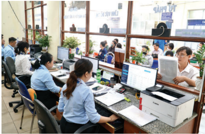
► Tiếp tục hoàn thiện, nâng cao hiệu quả vận hành mô hình chính quyền địa phương 02 cấp.

chính sách, nâng cao tính khả thi trong thực thi chính sách và giảm thiểu xung đột xã hội. Đây chính là mục tiêu, yêu cầu quan trọng của phát huy dân chủ và công tác dân vận.