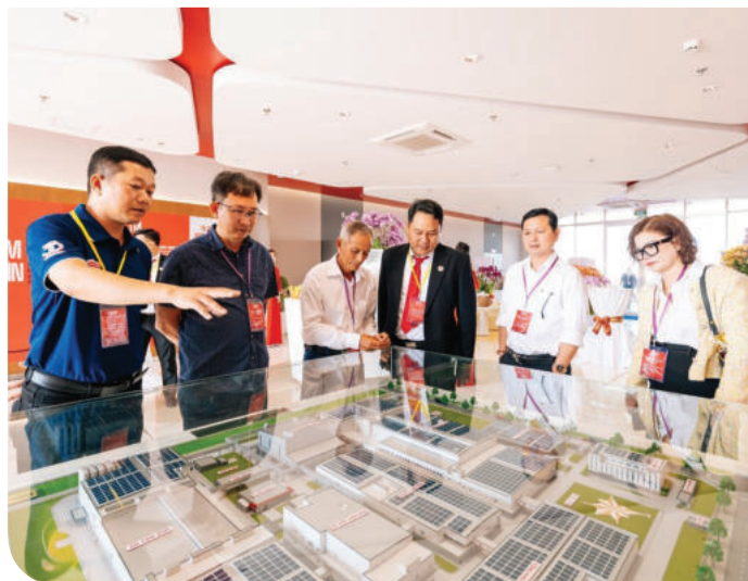
► Khách tham dự lễ khánh thành tham quan văn phòng làm việc chi nhánh Vinh Long.