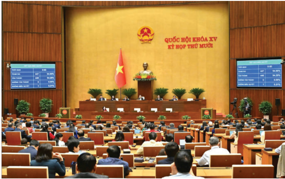
► Quốc hội biểu quyết thông qua Luật Hoạt động giám sát của Quốc hội và Hội đồng nhân dân (sửa đổi) ngày 10/02/2025.

Bốn là , trong lĩnh vực lập pháp, Quốc hội chủ động mở rộng không gian tham gia của Nhân dân ngay từ giai đoạn xây dựng chính sách và soạn thảo luật. Việc công khai lấy ý kiến đối với dự thảo luật và chính sách quan trọng không chỉ giúp nâng cao chất lượng quy phạm, mà còn thể hiện quan niệm đúng đắn rằng Nhân dân giám sát từ “đầu vào” của hoạt động lập pháp sẽ hạn chế nguy cơ xa rời thực tiễn, khép kín trong quy trình, hoặc bị chi phối bởi lợi ích cục bộ. Khi tiếng nói của cộng đồng xã hội được tiếp nhận thực chất, pháp luật sẽ sát dân hơn, khả thi hơn và phục vụ tốt hơn.