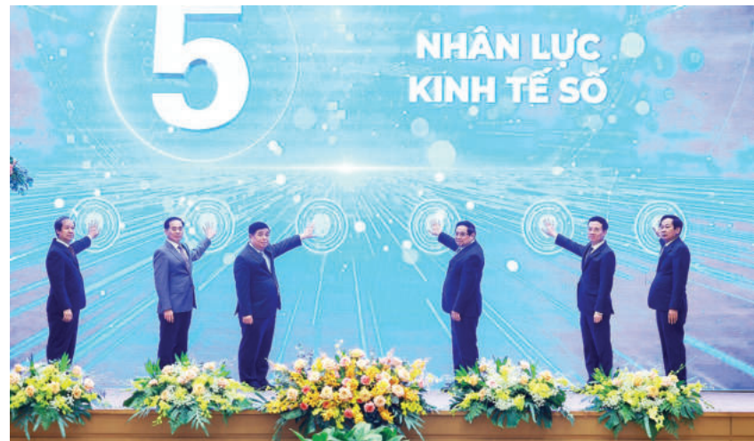
► Ủy viên Bộ Chính trị, Thủ tướng Chính phủ Phạm Minh Chính và các đại biểu phát động Chương trình Học từ làm việc thực tế, tại Diễn đàn Quốc gia phát triển kinh tế số và xã hội số lần thứ III, ngày 20/12/2025.

Chính sách việc làm trước hết phải hướng tới mục tiêu an sinh xã hội, tạo việc làm cho người dân không chỉ giúp họ có thu nhập để trang trải cuộc sống mà còn góp phần giảm thiểu các vấn đề xã hội như nghèo đói, tệ nạn, bất ổn xã hội. Vì vậy, chính sách việc làm được coi là một trong những chính sách cơ bản trong hệ thống chính sách xã hội nói chung. Trong quá trình phát triển của đất nước, Đảng và Nhà nước ta luôn quan tâm lãnh đạo, chỉ đạo vấn đề việc làm, ban hành chính sách việc làm phù hợp với sự phát triển kinh tế -