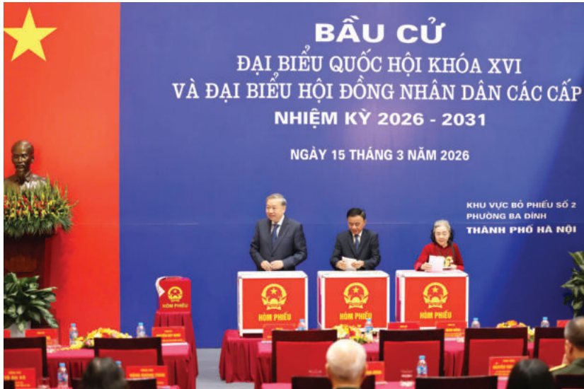
► Tổng Bí thư Tô Lâm bỏ phiếu bầu cử đại biểu Quốc hội khóa XVI và đại biểu Hội đồng nhân dân các cấp nhiệm kỳ 2026 - 2031 tại Khu vực bỏ phiếu số 02, phường Ba Đình, thành phố Hà Nội, ngày 15/3/2026.

Thứ nhất, cử tri cả nước tích cực đóng góp ý kiến cho Quốc hội thông qua kênh tiếp xúc cử tri và gửi các kiến nghị, góp ý đến các kỳ họp của Quốc hội.