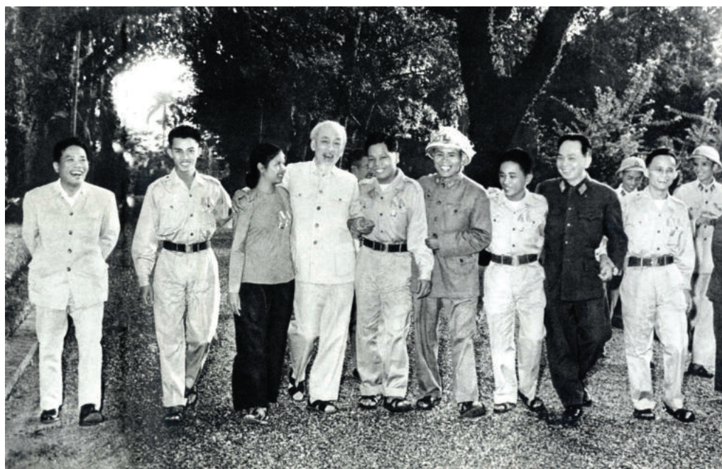
► Chủ tịch Hồ Chí Minh và Đại tướng Võ Nguyên Giáp cùng đoàn đại biểu Anh hùng Lực lượng vũ trang nhân dân giải phóng miền Nam.

Ban Dân chủ, giám sát và phản biện xã hội Ủy ban Trung ương Mặt trận Tổ quốc Việt Nam