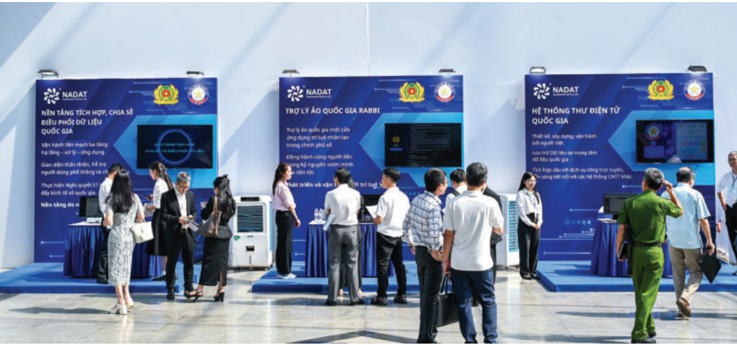
► Trung tâm Sáng tạo, khai thác dữ liệu (Trung tâm Dữ liệu quốc gia) và Hiệp hội Dữ liệu quốc gia giới thiệu 06 sản phẩm trong nghiên cứu, phát triển và ứng dụng công nghệ lõi, ngày 04/7/2025.

Thứ ba, tăng cường hợp tác quốc tế thông qua các thỏa thuận thương mại kỹ thuật số. Một kinh nghiệm nữa của Trung Quốc là những năm qua rất tích cực tham gia đàm phán các thỏa thuận và ký kết các biên bản ghi nhớ về kinh tế số hay thương mại điện tử xuyên biên giới với nhiều quốc gia. Thông qua hợp tác quốc tế giúp nước này thúc đẩy thương mại và khả năng quản trị kỹ thuật số, tạo không gian cho thương mại điện tử xuyên biên giới phát triển.