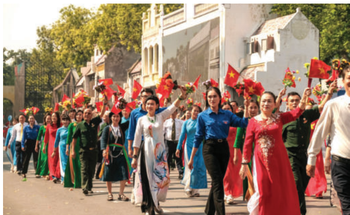
► Tinh thần đoàn kết là cội nguồn sức mạnh chiến thắng của Nhân dân ta.

đoạt lấy toàn bộ tư bản trong tay giai cấp tư sản, để tập trung tất cả những công cụ sản xuất vào trong tay nhà nước, tức là trong tay giai cấp vô sản đã được tổ chức thành giai cấp thống trị và để tăng thật nhanh số lượng những lực lượng sản xuất (11) .