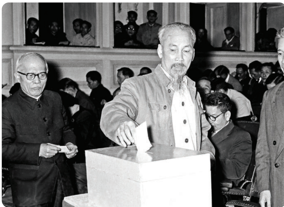
► Chủ tịch Hồ Chí Minh bỏ lá phiếu đầu tiên bầu Ban Thường trực Quốc hội mới tại Kỳ họp thứ Sáu, Quốc hội Khóa I (năm 1956).

Ngày 06/01/1946, dù cho phải đối mặt với muôn vàn khó khăn về an ninh và điều kiện tổ chức, gần 90% cử tri cả nước đã nô nức tham gia bỏ phiếu, bầu ra 333 đại biểu Quốc hội khóa I (trong đó có 57% số đại biểu thuộc các đảng phái khác nhau; 43% số đại biểu không đảng phái; 87% số đại biểu là công nhân, nông dân, chiến sĩ cách mạng; 10 đại biểu nữ và 34 đại biểu là người dân tộc thiểu số). Thành phần đại biểu phản ánh rõ nét tính đại diện rộng rãi của Quốc hội, đại biểu thuộc nhiều giai cấp, tầng lớp xã hội, dân tộc, tôn giáo, đảng phái yêu nước, trong đó có phụ nữ, người dân tộc thiểu số, nhân sĩ trí thức và chức sắc tôn giáo (5) .