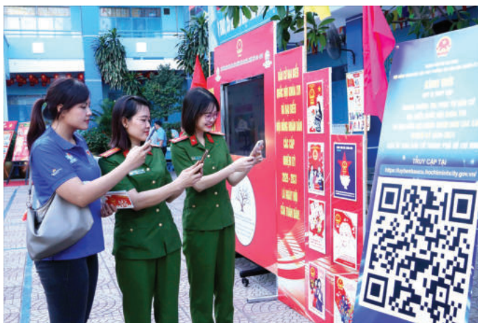
► Cử tri trẻ Thành phố Hồ Chí Minh quét mã QR để tham gia cuộc thi tìm hiểu về Luật Bầu cử trực tuyến.

Hình thức được thể hiện đa dạng thông qua các bài viết, infographic, video ngắn, tọa đàm trực tuyến, giúp nội dung chính trị - pháp lý trở nên sinh động, dễ hiểu, dễ tiếp nhận. Bên cạnh đó, nền tảng số còn tạo điều kiện cho sự tương tác hai chiều, giúp cán bộ, đảng viên trao đổi, đặt câu hỏi, bày tỏ ý kiến, qua đó, nâng cao hiệu quả định hướng tư tưởng. Trong đó, hình thức tuyên truyền được tổ chức linh hoạt, sáng tạo, kết hợp tuyên truyền trực tiếp với tuyên truyền gián tiếp, giữa giáo dục chính trị tập trung với sinh hoạt chi bộ, tọa đàm khoa học, trao đổi học thuật; ký kết giao ước thi đua “tăng tốc, bứt phá”. Viện Khoa học xã hội và Nhân văn quân sự sử dụng công nghệ thông tin điện tử, fanpage chính thống cập nhật kịp thời nghị quyết, chỉ thị, tài liệu bầu cử, giúp cấp ủy nắm chắc tình hình, định hướng thống nhất, bảo đảm nội dung tuyên truyền bầu cử chính xác, hiệu quả. Đặc biệt, Viện đã phát huy hiệu quả hệ thống thông tin nội bộ, chuyên mục tuyên truyền trên nền tảng số của đơn vị như trang Blog: Nhanvanviet.com; Chanlytienphong.com; trang Fanpage: Nhanvanviet; Sáng mãi niềm tin 25.10. Đồng thời, tuyên truyền trên các trang mạng xã hội chính thống khác của một số đơn vị trong Quân đội nhân dân Việt Nam. Qua đó, tạo không khí chính trị sôi nổi, dân chủ, đoàn kết, thống nhất, hướng tới ngày bầu cử thực sự trở thành ngày hội của toàn đơn vị.