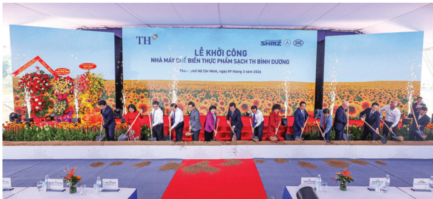
► Đại biểu thực hiện nghi thức khởi công Nhà máy chế biến thực phẩm sạch TH Bình Dương, ngày 09/03/2025.

quốc phòng, an ninh và bảo đảm đời sống nhân dân, chưa có chính sách kinh tế riêng về lao động - việc làm. Giai đoạn 1980 - 1990, Nhà nước thực hiện chế độ bao cấp việc làm trong nền kinh tế kế hoạch hóa tập trung. Lao động chủ yếu trong nông nghiệp, ít ngành nghề, thiếu việc làm, hiệu quả thấp. Từ năm 1990 đến nay, khi chuyển sang nền kinh tế thị trường định hướng xã hội chủ nghĩa, chính sách việc làm mở rộng và năng động hơn; khuyến khích phát triển kinh tế đa thành phần, thu hút đầu tư, đào tạo nghề, đưa lao động đi làm việc ở nước ngoài, từng bước hướng tới tạo việc làm bền vững và chất lượng.