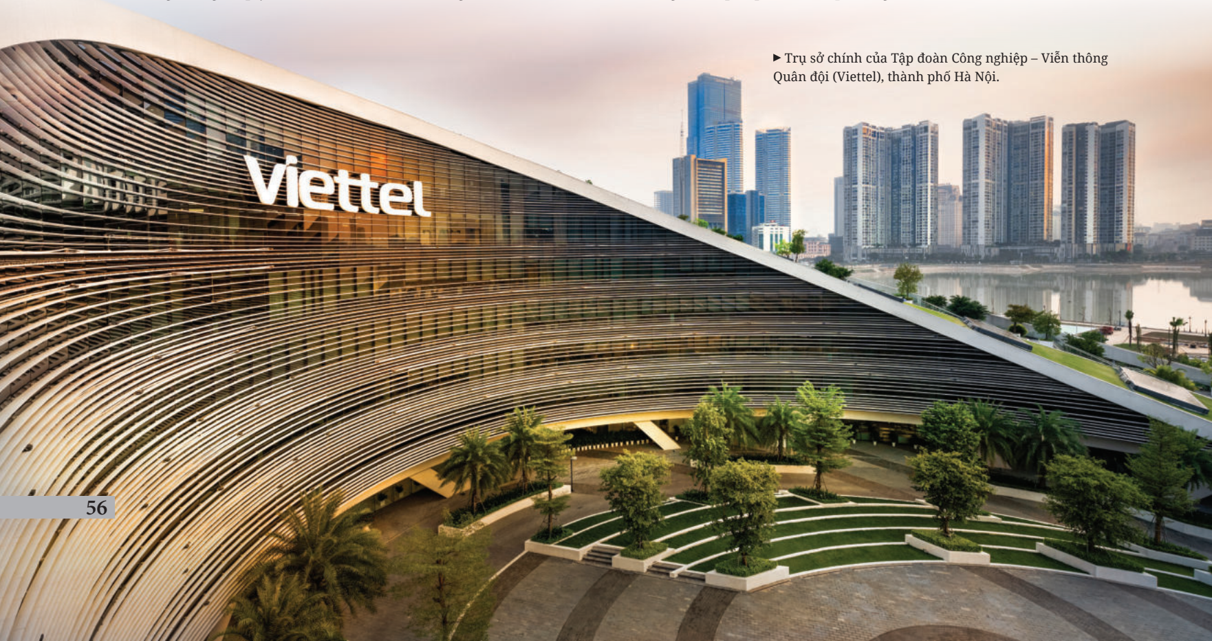
► Trụ sở chính của Tập đoàn Công nghiệp – Viễn thông Quân đội (Viettel), thành phố Hà Nội.

Xây dựng chính quyền số và vận dụng vào quản trị đô thị là xu hướng tất yếu trong tiến trình hiện đại hóa quản lý nhà nước. Trong mô hình CQĐP 02 cấp được triển khai từ ngày 01/7/2025 đến nay, chính quyền số càng khẳng định vai trò nền tảng, giúp bộ máy tinh gọn vận hành hiệu quả và phục vụ người dân tốt hơn. Để tiếp tục phát triển bứt phá trong kỷ nguyên mới, các cấp chính quyền cần xác định chuyển đổi số là nhiệm vụ chính trị, do đó cần giữ vững cam kết “chuyển đổi số toàn diện”, hoàn thiện thể chế, đầu tư nguồn lực cho hạ tầng và con người, đồng thời chú trọng an ninh mạng. Với quyết tâm từ Trung ương đến địa phương, mục tiêu xây dựng CQĐP số thông suốt, hiệu lực, hiệu quả, gần dân hơn sẽ sớm trở thành hiện thực, tạo động lực cho phát triển kinh tế - xã hội và nâng cao chất lượng, hiệu quả quản trị địa phương ở đô thị trên cả nước. 🌟