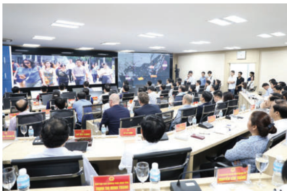
► Trung tâm điều hành thông minh tỉnh Quảng Ninh.