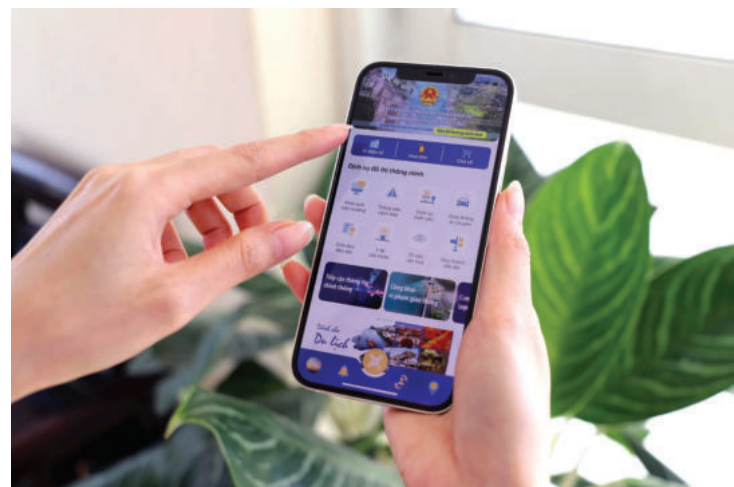
► Hue-S là điển hình phát triển ứng dụng cho thành phố thông minh.

Báo cáo khảo sát Chính phủ điện tử của Liên hợp quốc năm 2024 ghi nhận: Việt Nam lần đầu tiên thuộc nhóm cao về phát triển Chính phủ số, với Chỉ số phát triển Chính phủ điện tử (EGDI) đạt 0,7709 (vượt mức trung bình châu Á là 0,6990). Việt Nam xếp hạng 71/193 quốc gia, tăng 15 bậc so với năm 2022 và cao nhất từ trước đến nay. Liên hợp quốc đánh giá cao nỗ lực cải thiện chất lượng dịch vụ công trực tuyến của Việt Nam, coi đây là yếu tố then chốt giúp Việt Nam vươn lên nhóm quốc gia dẫn đầu mới nổi về chính phủ số. Kết quả này cho thấy, sự chỉ đạo