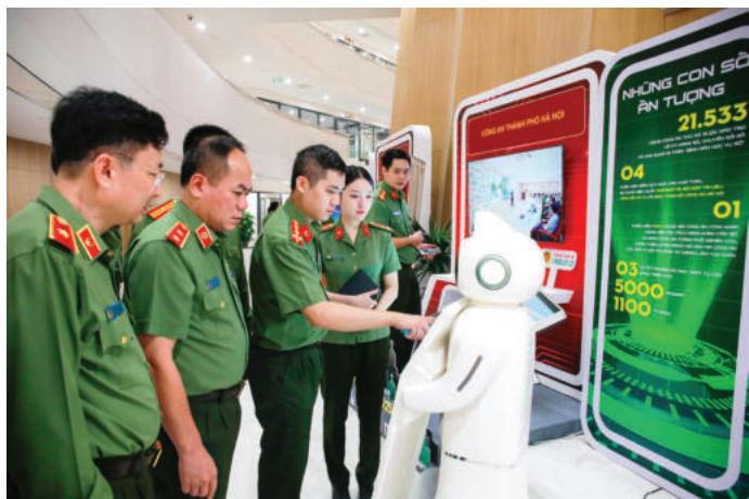
► Lực lượng Công an nhân dân tiến tới chuyển đổi số toàn diện trong giai đoạn 2025 - 2030.

trị công theo hướng hiện đại, minh bạch, dựa trên dữ liệu. Đây là điều kiện tiên quyết để bảo đảm chuyển đổi số không chỉ là việc đầu tư hạ tầng, công nghệ, mà còn gắn liền với sự thay đổi tư duy và hành động của con người trong bộ máy hành chính. Cùng với đó, cần khuyến khích văn hóa đổi mới trong khu vực công; có cơ chế khen thưởng, đánh giá phải dựa trên hiệu quả ứng dụng công nghệ số vào công việc.