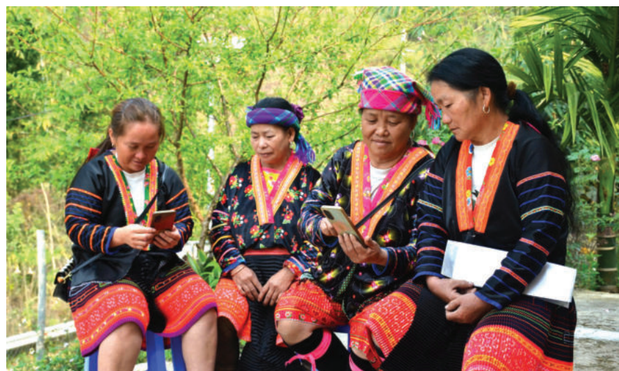
► Đồng bào dân tộc Mông bản Cống Trời (xã Na Sang, tỉnh Điện Biên) tìm hiểu thông tin bầu cử qua điện thoại thông minh.

Ba là , Quốc hội coi việc tiếp nhận, xử lý và theo dõi giải quyết kiến nghị, khiếu nại của cử tri là biểu hiện rõ nhất của tinh thần “giám sát đến cùng”. Kiến nghị khiếu nại của cử tri không dừng lại ở khâu tiếp nhận, mà được tổng hợp, phân loại, chuyển đến đúng cơ quan có thẩm quyền, yêu cầu trả lời và đôn đốc thực hiện; qua đó tạo thành một “chu trình giám sát” chặt chẽ từ phản ánh của Nhân dân đến trách nhiệm của cơ quan tổ chức nhà nước, từ cam kết chính sách đến kết quả thực hiện. Cùng với đó, hoạt động tiếp công dân, tiếp nhận đơn thư theo quy định tiếp tục khẳng định nguyên tắc: mọi phản ánh chính đáng của Nhân dân đều phải được lắng nghe và xử lý trong khuôn khổ pháp luật.