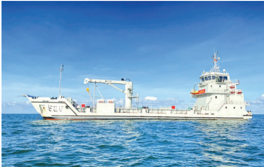
► Tàu 526 thuộc Vùng 5 Hải quân cấp nước cho người dân đảo Hòn Chuối, Cà Mau.

An ninh lương thực: Tây Nam Bộ được biết đến là vùng đất giàu tiềm năng, có 2.575,2 nghìn ha đất sản xuất nông nghiệp, chiếm 62,9% tổng diện tích đất tự nhiên của cả vùng (10) ; đóng góp 56% sản lượng lúa gạo (24,5 triệu tấn), 98% sản lượng cá tra (1,41 triệu tấn) và 60% các loại trái cây cả nước (4,3 triệu tấn), 95% lượng gạo xuất khẩu và 60% lượng thủy sản xuất khẩu của Việt Nam. Nhờ đặc điểm này mà vấn đề an ninh lương thực của vùng luôn được bảo đảm, không chỉ vậy, còn góp phần nâng cao sản lượng lúa, gạo dự trữ và xuất khẩu của quốc gia.