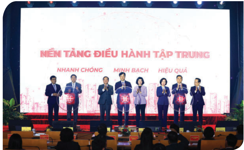
► Ủy viên Bộ Chính trị, Bí thư Thành ủy Hà Nội Nguyễn Duy Ngọc và Phó Chủ tịch Quốc hội Nguyễn Khắc Định cùng các lãnh đạo thành phố Hà Nội thực hiện nghi thức khai trương nền tảng điều hành tập trung 02 cấp, ngày 17/3/2026.

Thực tiễn cho thấy quản trị địa phương tại các đơn vị hành chính cấp tỉnh ở Việt Nam hiện nay đang đối mặt với một số thách thức như: