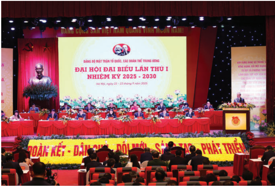
► Đại hội Đại biểu lần thứ I Đảng bộ Mặt trận Tổ quốc, các đoàn thể Trung ương, nhiệm kỳ 2025 - 2030, ngày 22 - 23/9/2025.

cách thẳng thắn. Một số quy chế phối hợp còn chung chung, chưa xác định rõ trách nhiệm, quyền hạn và quy trình phối hợp; việc triển khai nhiều khi mang tính hình thức, chưa tạo được sự gắn kết chặt chẽ, thường xuyên. Cơ chế trao đổi thông tin giữa các bên chưa thực sự kịp thời, thiếu tính hai chiều; phản hồi của cơ quan nhà nước đối với kiến nghị của Nhân dân đôi khi còn chậm, chưa đầy đủ, làm giảm tính thuyết phục. Hoạt động giám sát, phản biện xã hội tuy có bước tiến nhưng chưa đồng đều, hiệu quả chưa cao, chưa thực sự trở thành kênh thông tin quan trọng để hoạch định và điều chỉnh chính sách. Điều đó đặt ra yêu cầu phải tiếp tục đổi mới, hoàn thiện và nâng cao chất lượng thực hiện quy chế phối hợp.