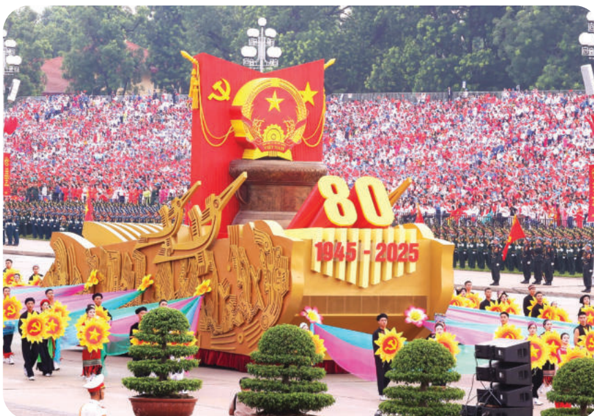
► Lễ diễu binh, diễu hành kỷ niệm chào mừng 80 năm Cách mạng tháng Tám thành công và Quốc khánh 2/9.

Với mục tiêu phát triển đất nước, Đảng và Nhà nước ta đã xác định các mốc phát triển quan trọng, được cụ thể hóa trong các văn kiện, nghị quyết, đặc biệt là Nghị quyết Đại hội ĐBTV lần thứ XIII của Đảng: Đến năm 2030 (kỷ niệm 100 năm thành lập Đảng Cộng sản Việt Nam): Việt Nam là nước đang phát triển, có công nghiệp hiện đại, thu nhập trung bình cao. Đến năm 2045 (kỷ niệm 100 năm thành lập nước Cộng hòa xã hội chủ nghĩa Việt Nam): trở thành