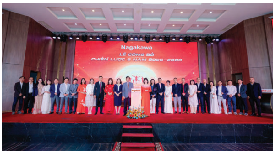
► Lãnh đạo Tập đoàn Nagakawa trong lễ công bố Chiến lược 5 năm 2026 - 2030.

Không chỉ thành công trong việc chuyển hướng đầu tư kinh doanh, Nagakawa còn được biết đến là một doanh nghiệp có trách nhiệm xã hội thông qua các chương trình thiết thực. Trong