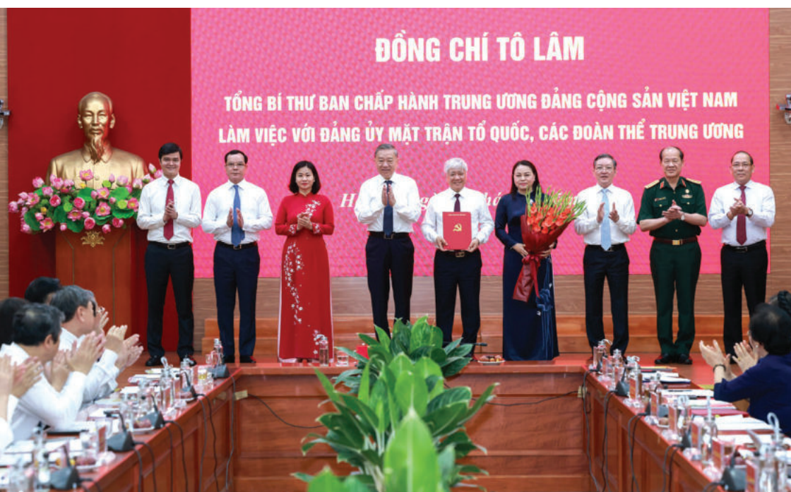
► Tổng Bí thư Tô Lâm làm việc với Đảng ủy Mặt trận Tổ quốc, các đoàn thể Trung ương và trao quyết định của Bộ Chính trị về việc thành lập Cơ quan Ủy ban Trung ương MTTQ Việt Nam, ngày 23/6/2025.

Việc xây dựng và thực hiện hiệu quả quy chế phối hợp giữa Mặt trận Tổ quốc Việt Nam, các tổ chức chính trị - xã hội và cơ quan nhà nước có ý nghĩa quan trọng trong việc phát huy quyền làm chủ của Nhân dân. Do đó, cần nâng cao nhận thức và trách nhiệm của các chủ thể trong hệ thống chính trị, coi phối hợp công tác là nhiệm vụ thường xuyên để bảo đảm tiếng nói của Nhân dân được lắng nghe kịp thời. Đồng thời, hoàn thiện quy chế phối hợp theo hướng rõ ràng, đồng bộ, sát thực tiễn, xác định cụ thể trách nhiệm và cơ chế phối hợp. Bên cạnh đó, cần tiếp tục đổi mới phương thức phối hợp, đẩy mạnh ứng dụng công nghệ thông tin, mở rộng giám sát và phản biện xã hội, chú trọng sơ kết, tổng kết, đánh giá để kịp thời rút kinh nghiệm, hoàn thiện cơ chế phối hợp, bảo đảm quyền làm chủ của Nhân dân được thực hiện ngày càng hiệu quả.