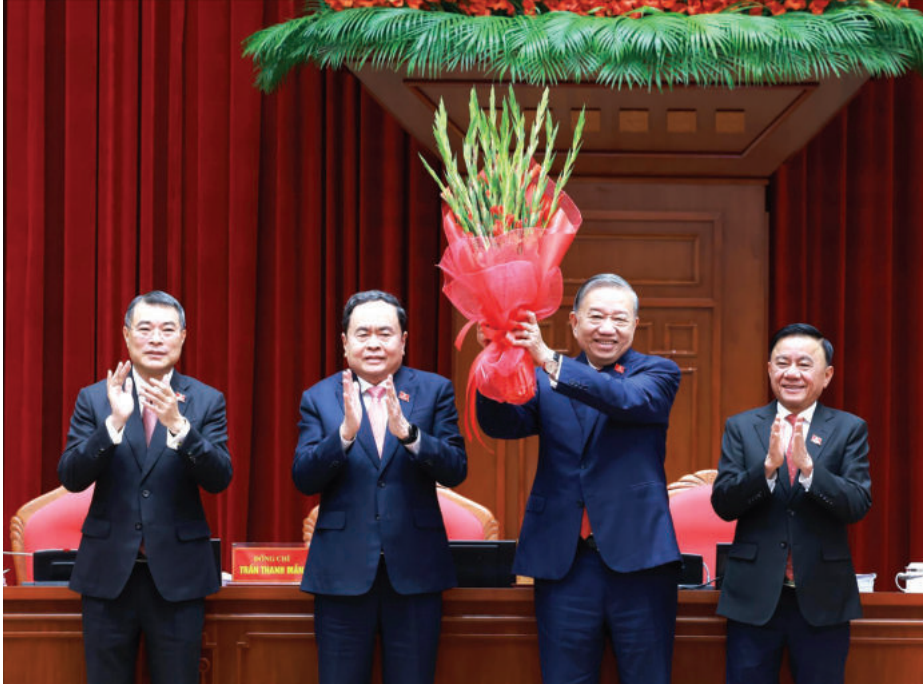
► Ban Chấp hành Trung ương Đảng khóa XIV đã thống nhất tuyệt đối bầu đồng chí Tô Lâm, Tổng Bí thư Ban Chấp hành Trung ương Đảng khóa XIII tiếp tục giữ chức Tổng Bí thư Ban Chấp hành Trung ương Đảng khóa XIV, ngày 23/01/2026.