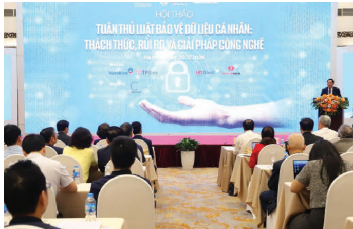
► Hội thảo khoa học "Tuần thủ luật bảo vệ dữ liệu cá nhân - Những thách thức, rủi ro và giải pháp công nghệ".

xây dựng đô thị. Nhiều địa phương tổ chức lấy ý kiến người dân qua môi trường số đối với các dự án quy hoạch, đổi mới phương thức họp tổ dân phố qua ứng dụng chat nhóm... Nhờ đó, khoảng cách giữa chính quyền và cư dân đô thị được thu hẹp, tạo nên quản trị đô thị dân chủ, gần dân hơn. Đây cũng chính là tinh thần của mô hình CQĐP 02 cấp - cấp xã là gần dân nhất, khi được trang bị công nghệ và phân quyền đầy đủ sẽ “nắm bắt nhanh nhu cầu, nguyện vọng và phản hồi trực tiếp” với người dân, và chính quyền số là yếu tố rất quan trọng làm cho mối liên hệ này trở nên mật thiết.