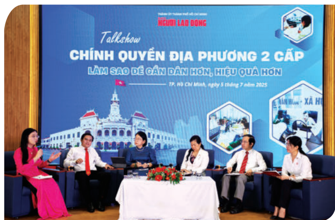
► Talkshow "Chính quyền địa phương 02 cấp, làm sao để gần dân hơn, hiệu quả hơn", ngày 05/7/2025.

Ba là , nâng cao năng lực quản trị địa phương. Việc nâng cao năng lực quản trị địa phương cần đặt ra với các chủ thể liên quan từ CQĐP đến người dân, tổ chức, doanh nghiệp. Với chính quyền ở xã, phường, việc tập trung một khối lượng lớn nhiệm vụ mới, phức tạp hơn từ cấp huyện trước đây cho cấp xã đang đặt ra một vấn đề về năng lực của chính quyền cơ sở. Thực tế, cấp xã hiện nay ở nhiều nơi vẫn còn hạn chế về chất lượng đội ngũ cán bộ, nguồn lực tài chính và hạ tầng công nghệ. Nếu không có một kế hoạch tổng thể và đầu tư tương xứng từ đào tạo, bồi dưỡng cán bộ đến tăng cường nguồn lực cho cấp xã... sẽ có nguy cơ xảy ra tình trạng quá tải, tắc nghẽn trong giải quyết công việc, ảnh hưởng trực tiếp đến người dân.