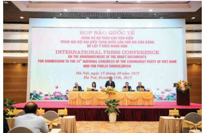
► Hội báo quốc tế công bố dự thảo các văn kiện trình Đại hội XIV của Đảng để lấy ý kiến Nhân dân, ngày 15/10/2025.

Chia rẽ mối quan hệ đạo đức giữa Đảng với Nhân dân, Đảng với Quân đội và Công an là một thủ đoạn trung tâm mà các thế lực thù địch đang ráo riết triển khai trên không gian mạng hiện nay.