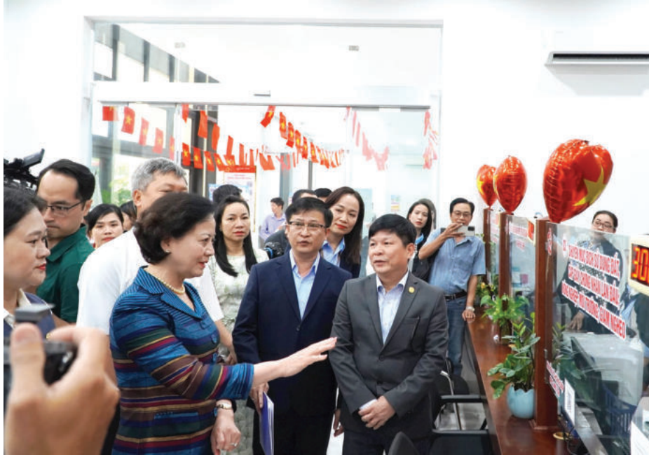
► Ủy viên Trung ương Đảng, Phó Thủ tướng Chính phủ Phạm Thị Thanh Trà thăm, kiểm tra Trung tâm Phục vụ hành chính công phường Hải Châu, thành phố Đà Nẵng, ngày 18/11/2025.

Vấn đề cốt lõi là phải đào tạo được một đội ngũ cán bộ đáp ứng đầy đủ yêu cầu, nhiệm vụ và vị trí công việc mới. Nội dung đào tạo, bồi dưỡng phải được thiết kế khoa học, bảo đảm trang bị đủ kiến thức, kỹ năng nghiệp vụ theo yêu cầu mới, đáp ứng tiêu chuẩn cho từng đối tượng, từng vị trí công tác cụ thể. Điều này giúp cán bộ có đủ năng lực giải quyết tốt các vấn đề mới phát sinh trong quá trình vận hành mô hình chính quyền địa phương 02 cấp. Đặc biệt, các chương trình đào tạo cần tập trung vào những kỹ năng then chốt như quản lý, ứng dụng công nghệ số trong quản lý hành chính, kỹ năng giao tiếp và giải quyết vấn đề, cũng như khả năng làm việc trong môi trường đa văn hóa - một yếu tố quan trọng khi thành phố mới có sự đa dạng về địa lý và văn hóa, xã hội.