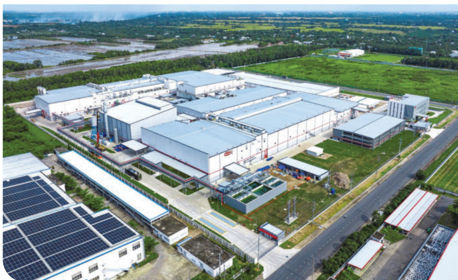
► Nhà máy Acecook Vinh Long mới được kỳ vọng sẽ là đòn bẩy kinh tế cho tỉnh Vinh Long và vùng Đồng bằng sông Cửu Long.

Bên cạnh đó, không gian sản xuất của nhà máy cũng được quy hoạch hài hòa với các mảng xanh trong khuôn viên, tạo nên môi trường làm việc thông thoáng và bền vững hơn cho người lao động. Doanh nghiệp dự kiến lắp đặt hệ thống điện mặt trời, giúp giảm khoảng 4.700 tấn CO 2 mỗi năm.