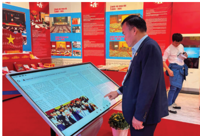
► Hội Sách - Báo Xuân Quảng Ninh được thiết kế theo hướng mở, hiện đại, kết hợp hài hòa giữa báo chí truyền thống và công nghệ số, ngày 12/02/2026.