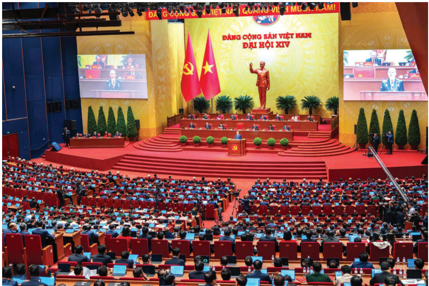
► Lễ khai mạc Đại hội đại biểu toàn quốc lần thứ XIV của Đảng, ngày 20/01/2026.