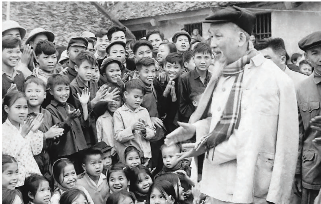
Bác Hồ nói chuyện với các cháu thiếu nhi trong dịp Người về thăm và chúc Tết đồng bào tỉnh Hà Bắc, ngày 09/02/1967.

Chủ tịch Hồ Chí Minh đã xác định con đường phát triển đúng đắn của Việt Nam là độc lập dân tộc gắn liền với chủ nghĩa xã hội, phát triển xã hội theo hệ giá trị bền vững: “Độc lập, Tự do, Hạnh phúc”. Trong tư tưởng và thực tiễn lãnh đạo cách mạng, Người luôn quan tâm chú trọng kết hợp sức mạnh dân tộc với sức mạnh thời đại trong bảo đảm an sinh xã hội, nâng cao đời sống vật chất, tinh thần cho Nhân dân. Kế thừa tư tưởng Hồ Chí Minh, Đảng Cộng sản Việt Nam đã vận dụng và phát triển sáng tạo tư tưởng của Người về kết hợp sức mạnh dân tộc với sức mạnh thời đại; tranh thủ, tiếp nhận nguồn ngoại lực, phát huy sức mạnh thời đại hỗ trợ nguồn nội lực tạo thành sức mạnh tổng thể, bảo đảm an sinh xã hội, nâng cao đời sống vật chất, tinh thần cho Nhân dân.