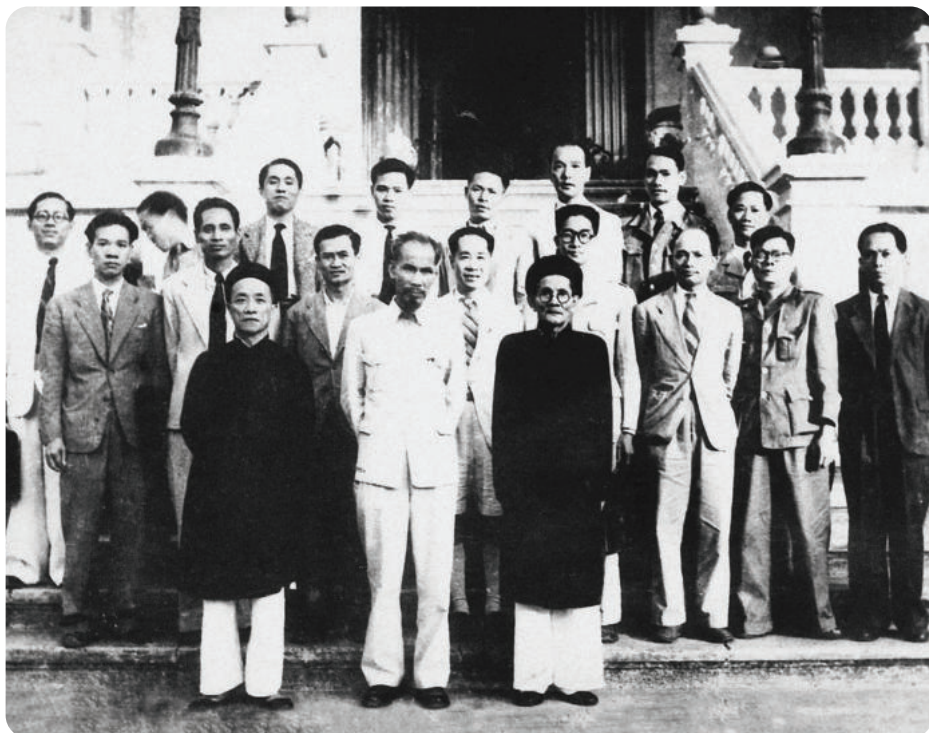
► Kỳ họp thứ Hai, Quốc hội Khóa I họp tại Hà Nội đã cử ra Chính phủ mới, Chủ tịch Hồ Chí Minh tiếp tục được bầu giữ chức Chủ tịch Chính phủ, ngày 03/11/1946.

Trải qua hai cuộc kháng chiến trường kỳ, thống nhất đất nước, xây dựng và bảo vệ Tổ quốc; bước vào công cuộc đổi mới và hội nhập sâu rộng, Quốc hội luôn đồng hành cùng dân tộc, là nơi những quyết sách trọng đại phản ánh ý chí, nguyện vọng của Nhân dân được thảo luận dân chủ, thông qua và triển khai quyết liệt, hiệu quả. 80 năm lịch sử vẻ vang của Quốc hội Việt Nam là một hành trình kiên định, sáng tạo, không ngừng đổi mới và gắn bó, đồng hành cùng Nhân dân.