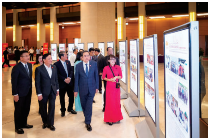
► Chủ tịch Quốc hội Trần Thanh Mẫn cùng các đồng chí lãnh đạo Quốc hội, Chính phủ tham quan Triển lãm Dấu ấn hoạt động giám sát của Quốc hội Việt Nam tại Nhà Quốc hội, ngày 06/01/2026.

mỗi một đạo luật, mỗi một nghị quyết, quyết định do Quốc hội ban hành đều thấm đẫm tinh thần vì dân, phụng sự Nhân dân, mưu cầu hạnh phúc cho Nhân dân, dân tộc.