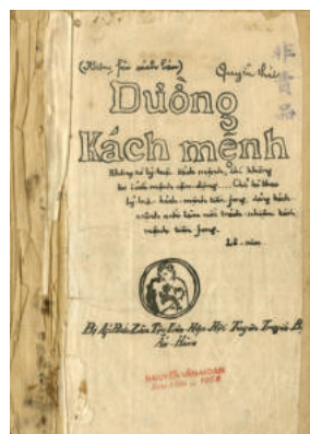
► Tác phẩm Đường Kách mệnh ra đời năm 1927.

Từ năm 1941 đến trước Cách mạng Tháng Tám năm 1945: là giai đoạn Chủ tịch Hồ Chí Minh hiện thực hóa và làm phong phú những luận điểm sáng tạo của Người về cách mạng Việt Nam bằng việc xác lập mô hình lý thuyết và triển khai xây dựng trên thực tế những hình thức tiến thân của Nhà nước và pháp luật kiểu mới ở Việt Nam. Trong giai đoạn này, lãnh tụ Nguyễn Ái Quốc - Hồ Chí Minh và Đảng Cộng sản Việt Nam chủ trương thành lập những hình thức tiến thân của Nhà nước và pháp luật (rộng ra là cả mô hình hệ thống chính trị xã hội chủ nghĩa ở Việt Nam) để sau khi giành được chính quyền sẽ trở thành chính thức. Tháng 5/1941, tại Hội nghị Ban Chấp hành Trung ương Đảng lần thứ 8, lãnh tụ Nguyễn Ái Quốc - Hồ Chí Minh và Đảng Cộng sản Việt Nam chủ trương thành lập Mặt trận Việt Minh nhằm đoàn kết, tập hợp các tầng lớp nhân dân, các đoàn thể cách mạng để chuẩn bị cho Tổng khởi nghĩa.