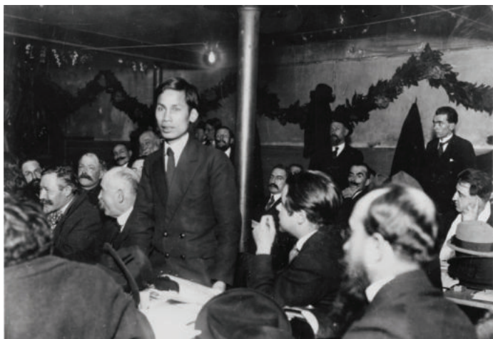
► Lãnh tụ Nguyễn Ái Quốc phát biểu tại Đại hội thành lập Đảng Cộng sản Pháp họp ở thành phố Tours, tháng 12/1920.

con đường giải phóng chúng ta!” (4) . Người khẳng định: muốn cứu nước và giải phóng dân tộc thì phải tiến hành cách mạng vô sản.