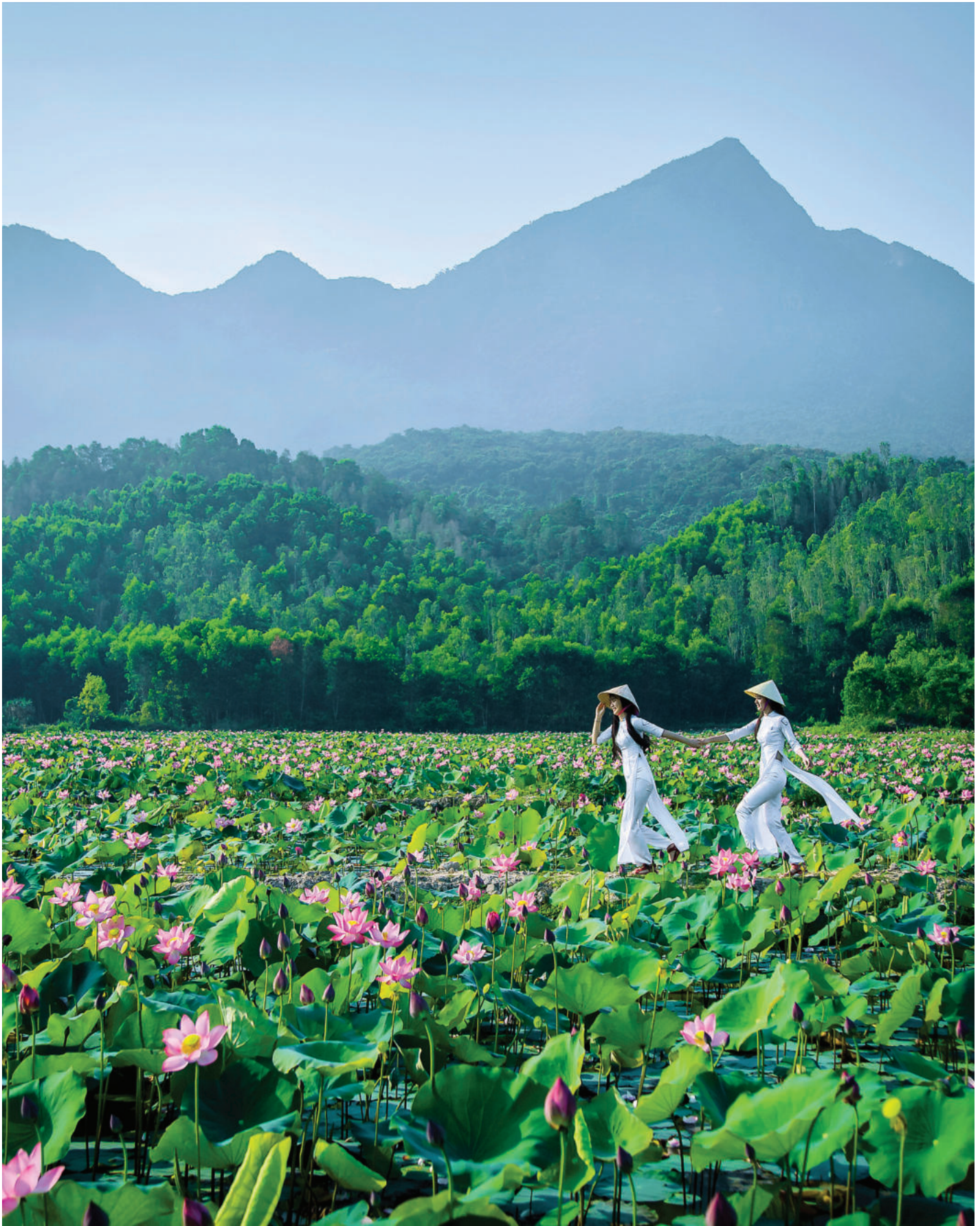
► Hương sắc Việt.