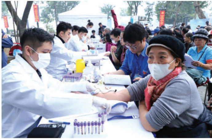
► Người cao tuổi được khám chữa bệnh miễn phí tại Hà Nội.