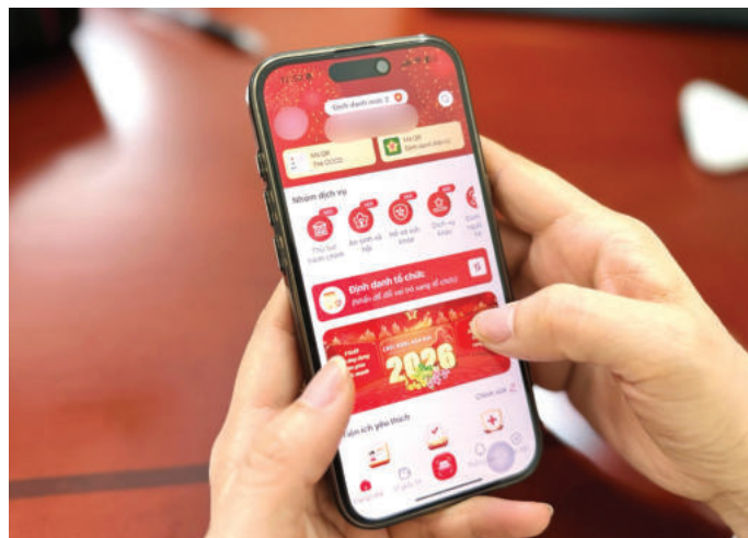
► Người dân có thể thực hiện thủ tục hành chính trực tuyến qua VNeID.

Chuyển đổi số trong quản trị công đang trở thành xu thế tất yếu, gắn liền với tiến trình hiện đại hóa nền hành chính nhà nước và hội nhập quốc tế. Trước những cơ hội và thách thức đan xen đó, việc đề xuất các giải pháp có tính tổng thể, đồng bộ như trên là hết sức cần thiết. Đây không chỉ là những giải pháp khắc phục hạn chế đã chỉ ra, mà còn góp phần đề xuất cách tiếp cận đa chiều để tận dụng tối đa lợi ích từ chuyển đổi số, đồng thời bảo đảm sự phát triển công bằng, bền vững cho toàn xã hội. Chuyển đổi số trong quản trị công ở Việt Nam trong giai đoạn hiện nay không chỉ là một lựa chọn chính sách, mà là một đòi hỏi mang tính lịch sử trong tiến trình hiện đại hóa đất nước; tiến nhanh hơn trên con đường trở thành quốc gia phát triển, có nền kinh tế xanh, số và bền vững trong kỷ nguyên vươn mình của dân tộc. 🌱