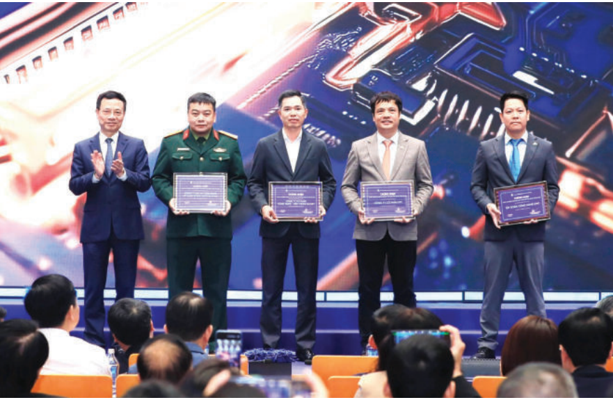
► Bộ trưởng Bộ Khoa học và Công nghệ Nguyễn Mạnh Hùng trao chứng nhận cho các đơn vị đồng hành cùng Trung tâm Đổi mới sáng tạo Hà Nội.

quyết liệt của Chính phủ và sự vào cuộc đồng bộ của các địa phương trong việc đẩy mạnh chính quyền số đã đem lại chuyển biến rõ nét. Một thước đo quan trọng là tỷ lệ TTHC được cung cấp trực tuyến mức độ cao. Tính đến cuối năm 2020, trung bình cả nước có 48,27% Dịch vụ công trực tuyến mức độ 4 (cho phép người dân thực hiện hoàn toàn qua mạng), tăng gấp 4,5 lần so với năm 2019.