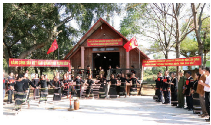
► Người dân tại buôn Cư Mblim, phường Ea Kao, tỉnh Đắk Lắk tổ chức đánh trống chiêng, múa hát thể hiện sự tin tưởng và kỳ vọng vào thành công của Đại hội Đại biểu toàn quốc lần thứ XIV của Đảng.

Thứ hai , chủ động ngăn chặn, khắc phục có hiệu quả những biểu hiện suy thoái về tư tưởng chính trị, đạo đức, lối sống của một bộ phận cán bộ, đảng viên. Các cơ quan, đơn vị cần phát huy vai trò, trách nhiệm của cán bộ, đảng viên, quân chúng trong đấu tranh phòng, chống suy thoái đạo đức, lối sống. Tăng cường công tác kiểm tra, giám sát và thi hành kỷ luật Đảng; thực hiện tốt tự phê bình và phê bình; đề cao tính nêu gương của đội ngũ cán bộ các cấp, nhất là cán bộ chủ trì, chủ chốt. Kiên quyết ngăn chặn, khắc phục những biểu hiện suy thoái về tư tưởng chính trị, đạo đức, lối sống; tình trạng quan liêu, tham nhũng, tiêu cực trong cơ quan, đơn vị. Thực hiện tốt công tác bảo vệ chính trị nội bộ, giữ vững kỷ cương, giữ nghiêm kỷ luật; xây dựng môi trường văn hóa trong sạch, lành mạnh, để tăng “sức đề kháng”, nâng cao khả năng tự bảo vệ của mỗi cán bộ, đảng viên và từng cơ quan, đơn vị. Từng cán bộ, đảng viên phải biết tự bảo vệ mình, nâng cao trình độ, năng lực, tinh cảm và lập trường cách mạng, bản lĩnh chính trị trước âm mưu, thủ đoạn chống phá của các thế lực thù địch.