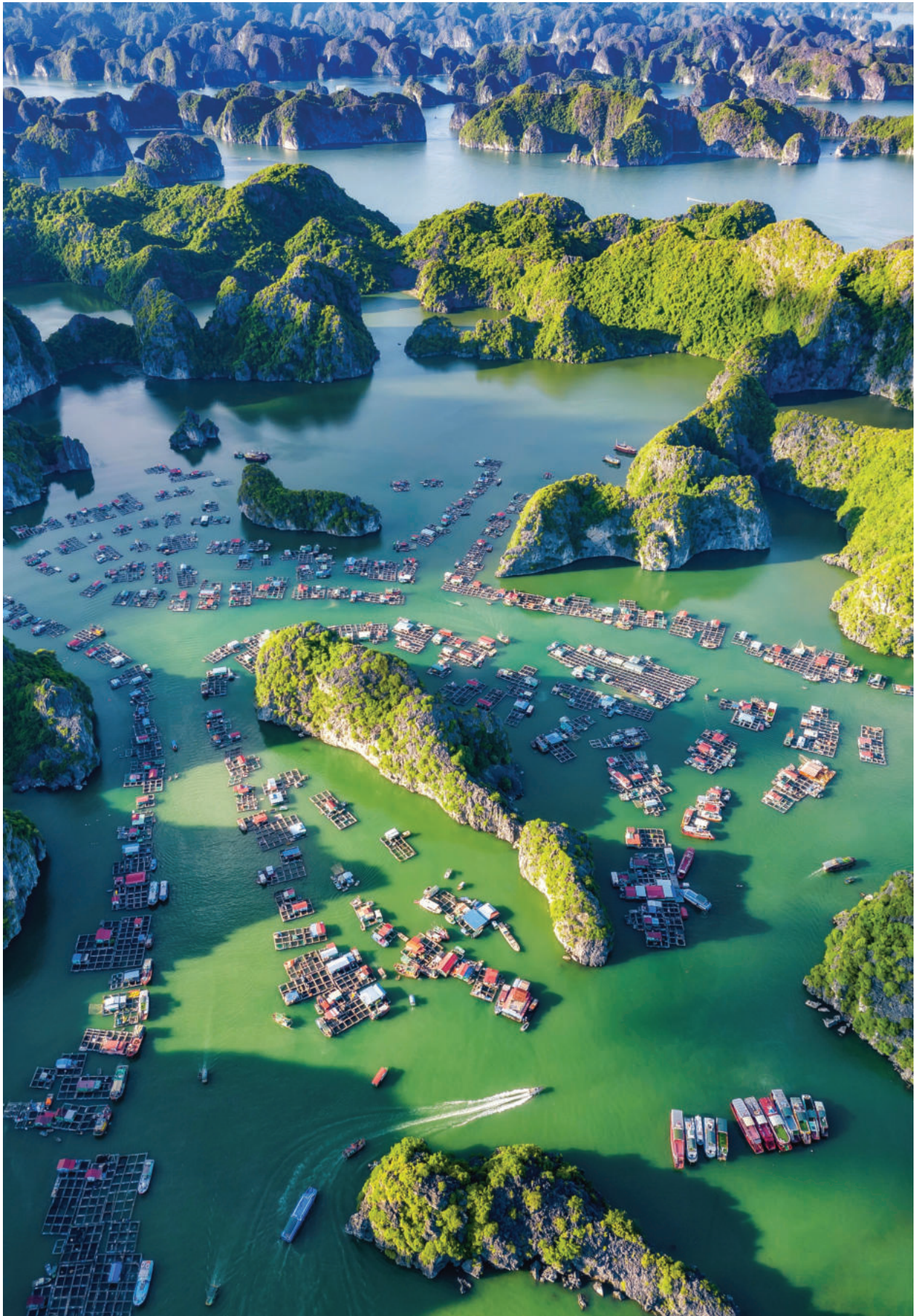
► Làng chài vịnh Lan Hạ, thành phố Hải Phòng.