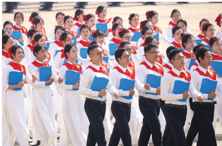
► Để Việt Nam có thể tăng tốc phát triển trong giai đoạn tới, một trong những yêu cầu bức thiết là phải nhanh chóng cải thiện chất lượng nguồn nhân lực.

Kinh nghiệm cho thấy, những thành phố phát triển trên thế giới cũng như trong khu vực đều là những nơi đầu tư mạnh mẽ vào yếu tố “con người”. Trong kỷ nguyên của kinh tế tri thức, sức mạnh cạnh tranh không chỉ đến từ cơ sở hạ tầng hay nguồn vốn, mà chất lượng nguồn nhân lực, nhất là đội ngũ cán bộ, công chức, viên chức quản lý có vai trò quan trọng nhất. Thành phố Đà Nẵng với truyền thống văn hiến cùng tinh thần đổi mới, sáng tạo đã được “minh chứng” qua nhiều năm cùng sự quyết tâm, thông qua những kế hoạch chi tiết, khoa học, đúng đắn, lộ trình cụ thể, trong việc xây dựng và phát triển đội ngũ cán bộ, công chức... Nguồn nhân lực chất lượng cao không chỉ là nền tảng cho sự thành công của mô hình chính quyền địa phương 02 cấp, mà còn là động lực quan trọng giúp thành phố tiếp tục khẳng định vị thế của Đà Nẵng - một trong những đô thị hiện đại, văn minh, đáng sống, góp phần tích cực vào sự phát triển chung của khu vực miền Trung - Tây Nguyên và cả nước. 🇻🇳