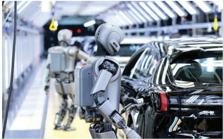
► Trung Quốc có mật độ robot trên mỗi công nhân trong các nhà máy cao hơn cả Mỹ và Nhật Bản.

Những năm qua, Trung Quốc đầu tư mạnh mẽ vào phát triển hạ tầng mạng internet, 5G và các hạ tầng kỹ thuật số khác, tạo điều