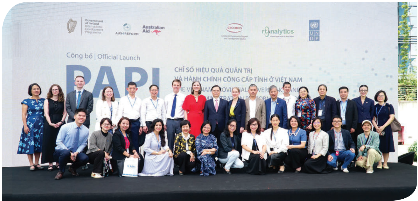
► Lễ Công bố Chỉ số Hiệu quả quản trị và Hành chính công cấp tỉnh ở Việt Nam (PAPI) năm 2024, ngày 15/4/2025.

Thứ tư , khung khổ pháp lý cho quản trị địa phương theo mô hình CQĐP 02 cấp vẫn đang tiếp tục được hoàn thiện. Trước hết là ở cấp xã, việc thiết lập CQĐP 02 cấp được coi là bước ngoặt, nhưng hiện chưa có quy định rõ ràng về cơ chế tổ chức bộ máy, phân bổ nguồn lực và bảo đảm tính kết nối giữa cấp tỉnh và cấp xã. Khoảng trống này đòi hỏi phải có hướng dẫn chi tiết bằng nghị định, thông tư, nhưng hiện nay vẫn còn thiếu. Các quy định pháp lý khung cơ bản định hình nhưng sự vận hành cụ thể lại đang thiếu các quy định để tổ chức thực hiện.